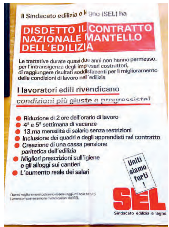
Plakat von 1990 für die Erneuerung des Landesmantelvertrags. Erstmals taucht die Forderung nach einer Frühpensionierung auf («cassa pensione»).

Nach zehn Jahren Kampf standen wir mit leeren Händen da; dies verursachte Frust und wurde zum Glaubwürdigkeitsproblem für die Gewerkschaft Bau und Industrie (GBI). Vor der Erneuerung des LMV 2002–2005 war es für die Bewegungsleitung deshalb klar, dass sich ein dritter Anlauf nur lohnte, wenn es am Ende des Verhandlungsprozesses gelingen könnte, eine fixfertige Lösung rasch in Kraft zu setzen. Die Zeit der Absichtserklärungen war vorbei. Um das Ziel endlich zu erreichen, musste die Frühpensionierung zur ersten Hauptforderung werden, sogar noch vor einer Lohnerhöhung. Und eine weitere Erkenntnis machte sich in der Gewerkschaft breit: Ohne offenen Kampf war ein früheres Pensionsalter nicht zu erhalten. Diese Einschätzung hat sich später als richtig erwiesen. Der Wechsel an der Spitze des Sektors Bau mit der Wahl von Hansueli Scheidegger im Jahr 1999 und der vorangegangene mehr