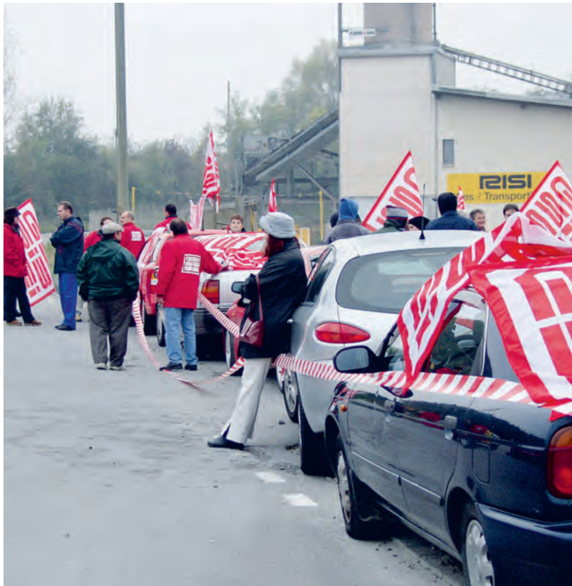
Hardliner Risi liefert keinen Kies mehr aus. Blockadeaktion in Cham, 10. Oktober 2002.