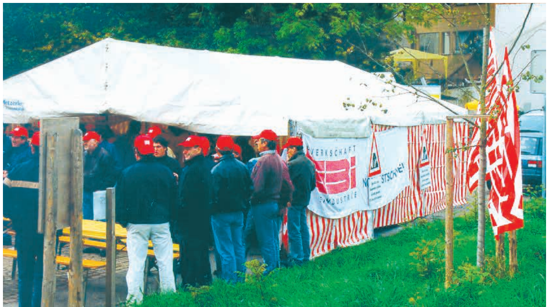
Protestaktion auf einer Baustelle der Firma Frey in Kaiseraugst, 10. Oktober 2002.