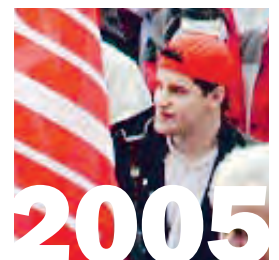
1. Januar 2005: Das Maler-, Gipser- und Plattenlegergewerbe von Basel-Stadt und das Fliesenlegergewerbe von Baselland schliessen sich der Stiftung RESOR an.

Trotz dieser Verurteilung kommen Bauarbeiter seit über zehn Jahren in den Genuss des mit dem FAR erkämpften sozialen Fortschritts.