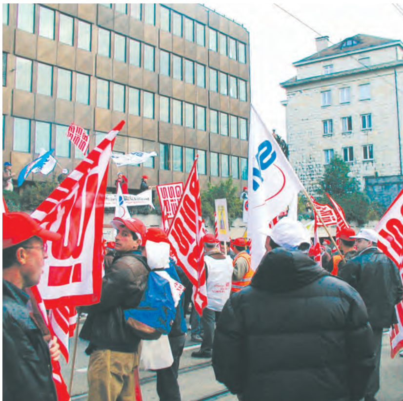
Protest vor dem Sitz des Baumeisterversbands in Zürich, 27. September 2002.