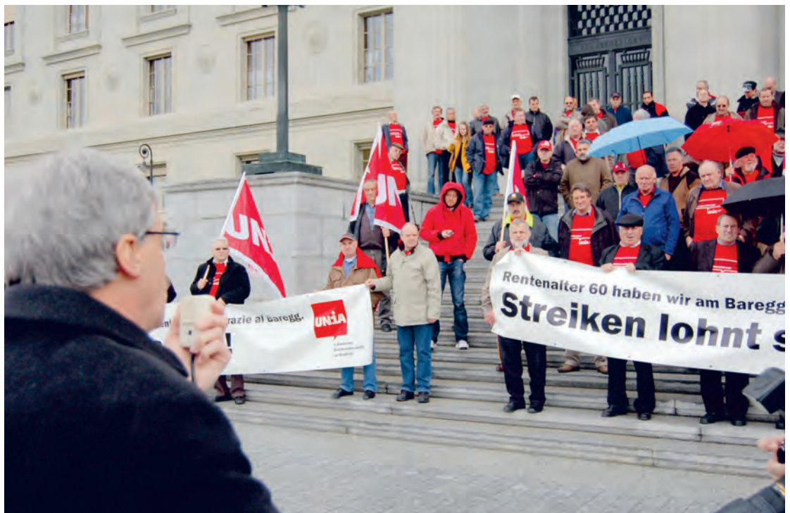
Die Verurteilung durch das Bundesgericht im April 2008 widerspricht internationalen Standards sowie der Auffassung der Internationalen Arbeitsorganisation (ILO).