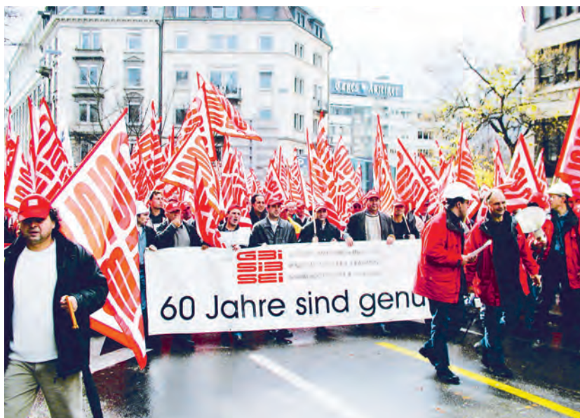
Demonstration in Zürich, nationaler Streiktag vom 4. November 2002.

bis dato ganz klar auf unserer Seite war, hätte jetzt kippen können. Als ich spät am Abend erschöpft ins Büro zurückkam und meinen PC startete, waren schon mehr als siebzig Protest-E-Mails von aufgebrauchten Automobilisten eingetroffen, die mit Strafanzeigen drohten oder diese ankündigten.