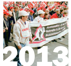
1. Januar 2013: Das Maler- und Plattenlegergewerbe von Baselland schliesst sich der Stiftung RESOR an.

Dank der Streikbewegung während des Jahres 2002 mit ihrem Schlusspunkt am Bareggturn-