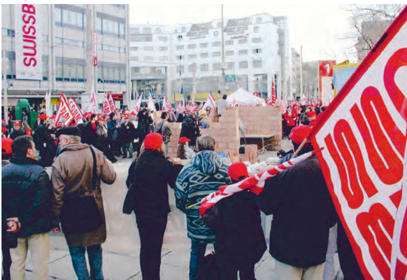
Protest vor der Swissbau in Basel, 18. Januar 2002.

«Es ging nichts kaputt, und es passierte zum Glück auch kein Unfall. Diese Aktion war nötig. Dank ihr haben wir bekommen, was wir wollten.»