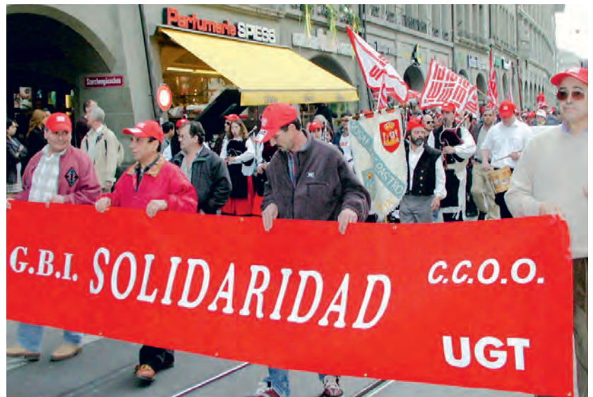
Nationale Baudemo, Umzug durch Bern, 16. März 2002.

Scheidegger: In diesem Kontext hatten wir aber verhandelt, und dies kommt in deinem Text nicht vor. Im Dezember 2001 lag mit Rentenalter 62 und einer mickrigen Lohnerrhöhung eine Lösung auf dem Tisch, die von der Verhandlungsdelegation unter Druck der Syna und auch der gemässigten Kräfte in den eigenen Reihen eventuell akzeptiert worden wäre, wenn wir nur beim Lohn noch etwas mehr bekommen hätten. Wir haben den sich abzeichnenden Kompromiss dann scheitern lassen. Innerhalb der Bewegung, auch innerhalb der Lei-