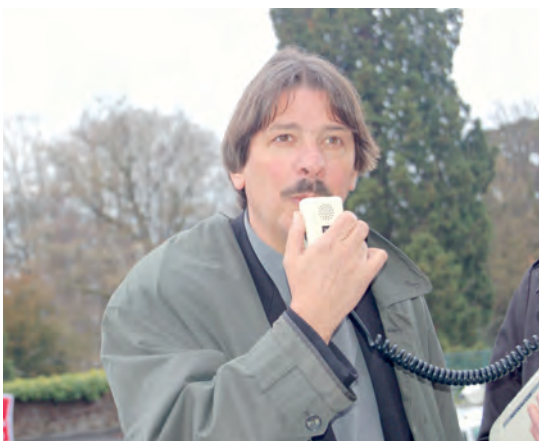
«Ausserordentliche Situationen erfordern besondere Antworten»: Paul Rechsteiner vor dem Bundesgerichtsgebäude, 3. April 2008.

Das Bundesgericht in Lausanne weist die Beschwerde der vier wegen der Aktion am Baregg verurteilten GBI-GewerkschafterInnen ab.