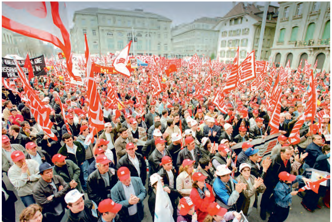
Nationale Baudemo auf dem Bundesplatz in Bern, 16. März 2002.