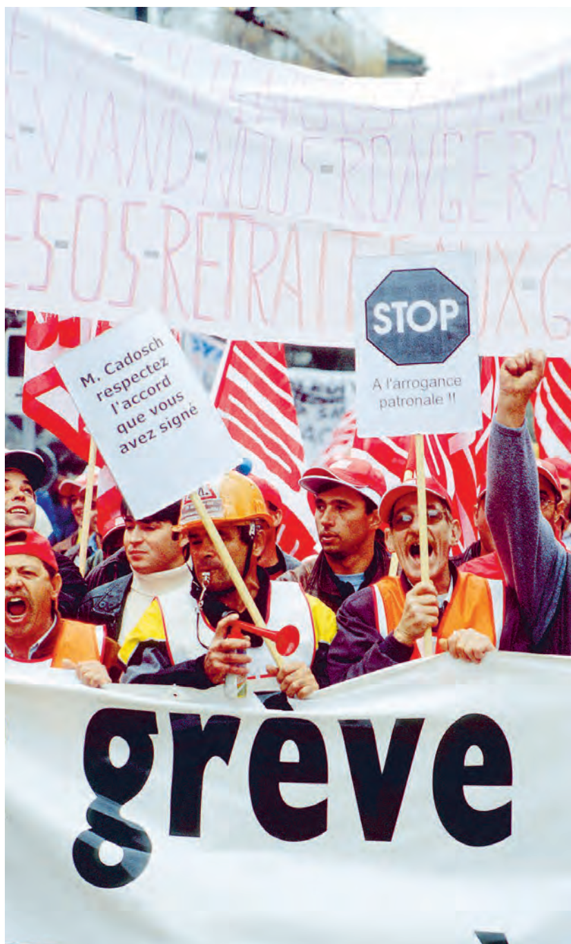
Nationaler Streiktag in Lausanne, 4. November 2002.

Bauarbeiter damals vorgezeigt, dass Einheit und Entschiedenheit der Arbeitnehmenden beim Verfolgen eines klaren und legitimen Ziels immer noch Siege möglich machen. Mit dem Rentenalter 60 wurde auf einen Schlag die Lebensarbeitszeit der Bauarbeiter um zehn Prozent reduziert! Ein exemplarischer Kampf und ein exemplarisches Resultat – beispielhaft auch für andere Bewegungen und für die Verteidigung aller sozialen Errungenschaften.