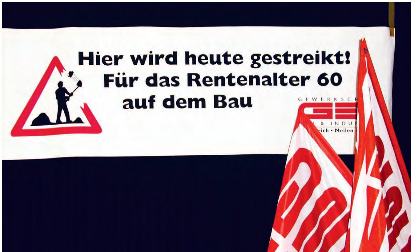
Transparent am nationalen Streiktag in Zürich, 4. November 2002.

dass die GBI früher oder später die Lohnfrage in den Mittelpunkt stellte. Es war ein grosses Verdienst der Bewegungsführung, dass es ihr gelang, die Delegierten der Berufskonferenz Bau der GBI vom 11. Oktober und vor allem vom 15. Dezember 2001 praktisch einhellig auf das Rentenalter 60 als zentrales Verhandlungsziel einzuschwören. Die übrigen Forderungen, insbesondere das Ausmass der Lohnerhöhung, waren von diesem Moment an vor allem taktische Elemente im Verhandlungsprozess.