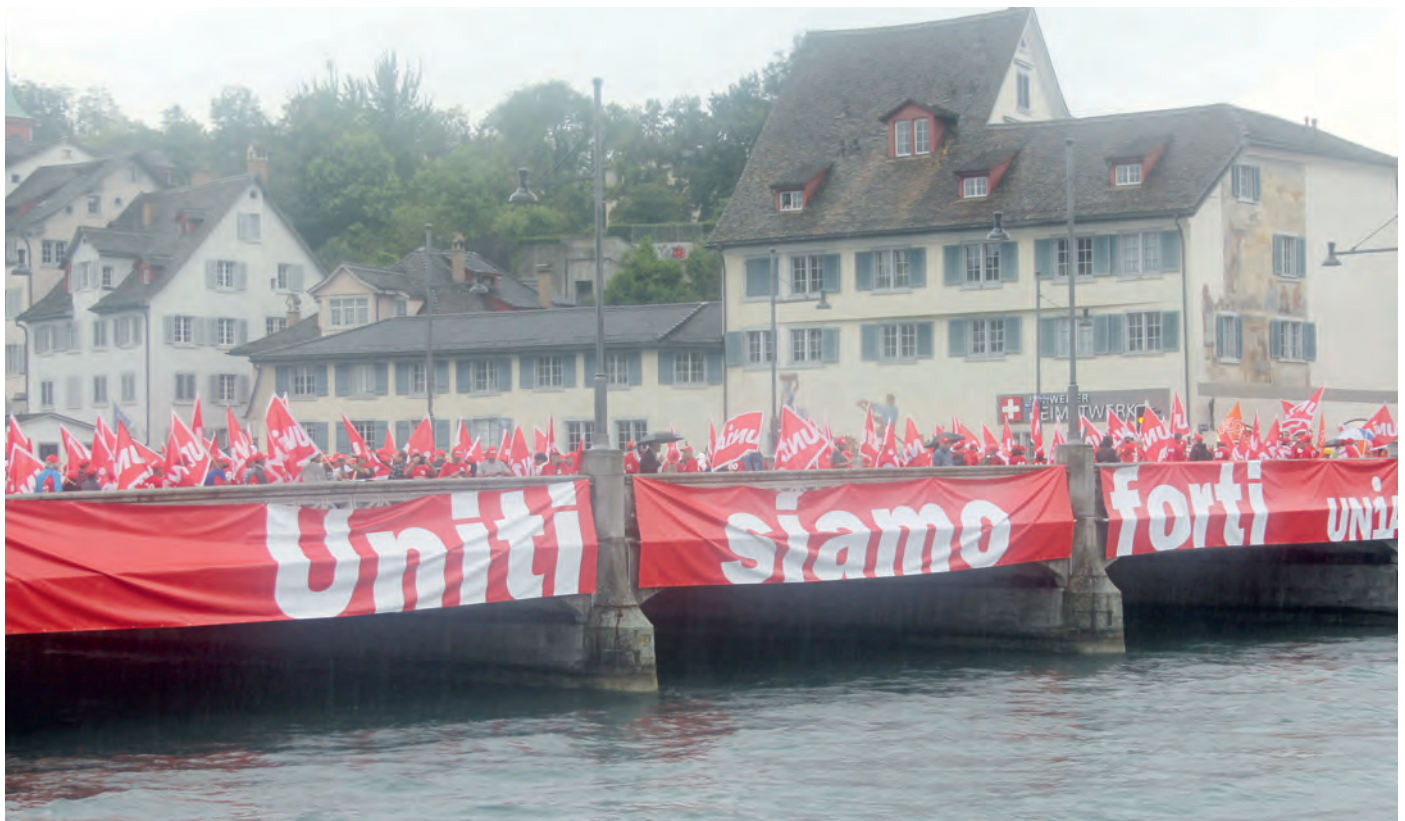
15 000 Bauarbeiter demonstrieren in Zürich für die Erhaltung des FAR 60 und für einen besseren Landesmantelvertrag, 27. Juni 2015.

Nachdem mit den Maler- und Gipsermeistern mehr als zehn Jahre lang über die Einführung eines Frühpensionierungsmodells gestritten wurde, scheint heute die Bereitschaft so gross wie noch nie, bei der bevorstehenden Vertragserneuerung eine Lösung analog dem Modell VRM zu finden.