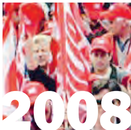
1. August 2008: Einführung eines Früh-pensionierungsmodells (analog zu RESOR) in der Marmor- und Granitbranche.