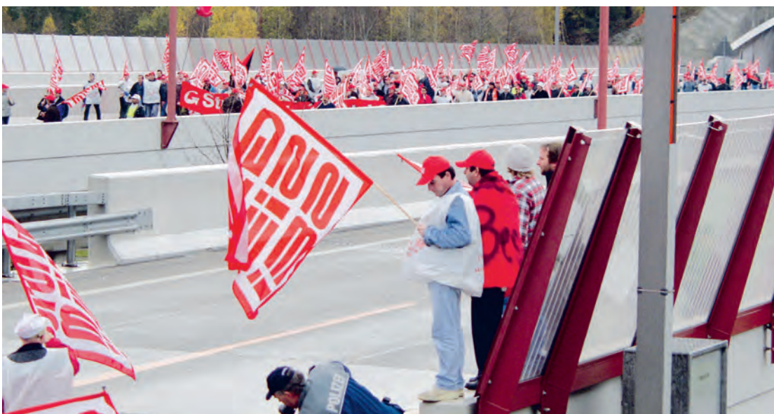
Streikende vor dem blockierten Baregg Tunnel, 4. November 2002.

16. März 2002: Grosse nationale Demonstration der Bauarbeiter in Bern, 12 000 TeilnehmerInnen, Konsultativabstimmung zum Streik auf dem Bundesplatz.