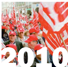
1. Januar 2010: Die Gebäudetechnik Tessin schliesst sich der Stiftung RESOR an.

so der Beiträge und die Überprüfung und Ausrichtung der Rentenleistungen einer gemeinsam zu errichtenden und zu verwaltenden Institution in der Form einer Stiftung übertragen werden. Um den gesetzlichen Anforderungen aus dem Bereich der beruflichen Vorsorge zu genügen, mussten die im GAV enthaltenen Regelungen über Beiträge und Leistungen in einem Reglement der Stiftung gespiegelt werden. Erst damit erhielt die Stiftung einerseits die Möglichkeit, selbstständig Beiträge einzufordern, andererseits wurde sie damit den Berechtigten gegenüber direkt verpflichtet.