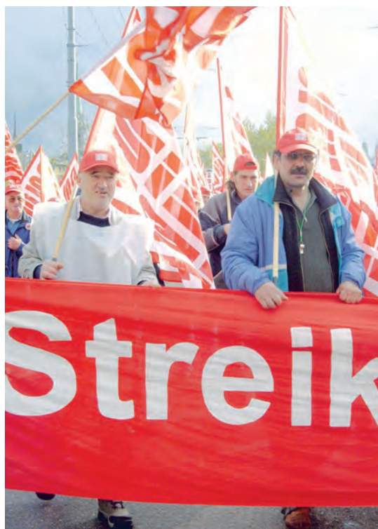
Umzug der Streikenden in Zürich, 4. November 2002.

Eine zweite, verbindlichere Absichtserklärung für ein Frührentenmodell wird im LMV 1995/97 verankert. Zu einer Lösung während der Vertragsdauer kommt es auch diesmal nicht.