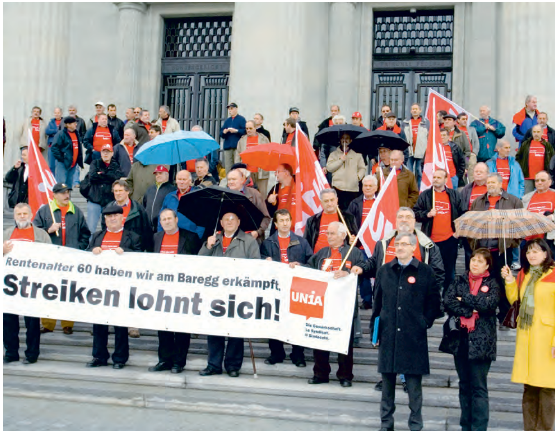
Der Baregg-Prozess vor Bundesgericht. Protestaktion mit Angeklagten, Vertrauensleuten und Frühpensionierten, 3. April 2008.

Im Ausbaugewerbe der Westschweiz tritt der GAV zum Frühpensionierungsmodell RESOR in Kraft. Die daraus entstandene Stiftung RESOR bietet eine Frühpension mit 62 Jahren.