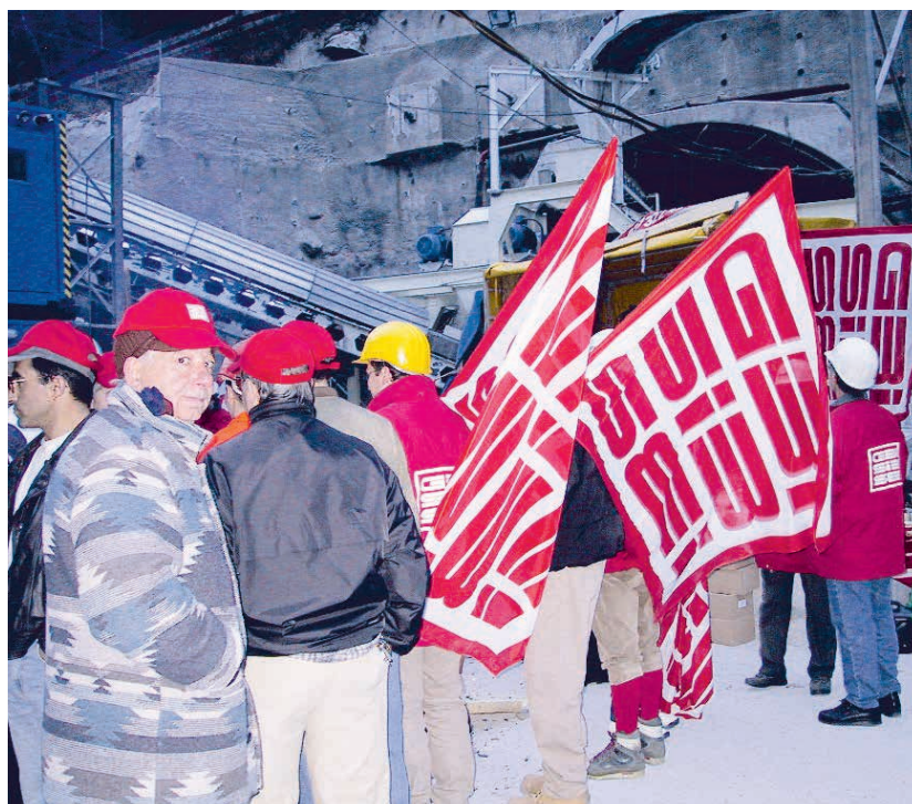
Streikaktion auf einer Baustelle im Raum Neuchâtel, 19. November 2001.

Angesichts der Tatsache, dass das Kürzel FAR bei den Arbeitgebern im Ausbaugewerbe zu einem absoluten Tabuwort geworden war und uns die nötige Mobilisierungskraft in den Ausbaubranchen fehlte, entschieden wir uns für eine andere Strategie: die regionale Ausweitung des Modells RESOR. FAR war Geschichte, RESOR jedoch war ein Fundament, auf das wir aufbauen konnten. In den folgenden