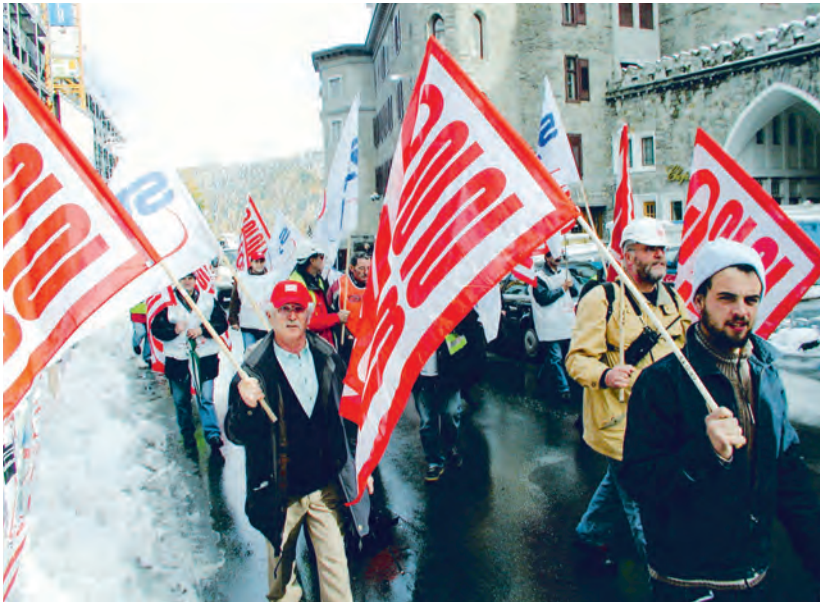
Umzug der Streikenden in St. Moritz, 18. Oktober 2002.