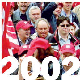
26. Januar 2002: Nach gescheiterten Verhandlungen beschliessen die GBI-Baudelegierten die Einleitung von Streikmassnahmen im Bauhauptgewerbe ab April 2002 und unterstreichen ihren Willen mit einer Demonstration in Basel.

(Das Gespräch wurde am 17. Januar 2014 in Zürich geführt.)