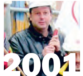
Oktober 2001: Regionale Mobilisierungen. Aktionen für mehr Mittel bei der Flexibilisierung des Rentenalters im Rahmen der 11. AHV-Revision. Gewerkschaftliche Besuche bei Ständeräten zu Hause.