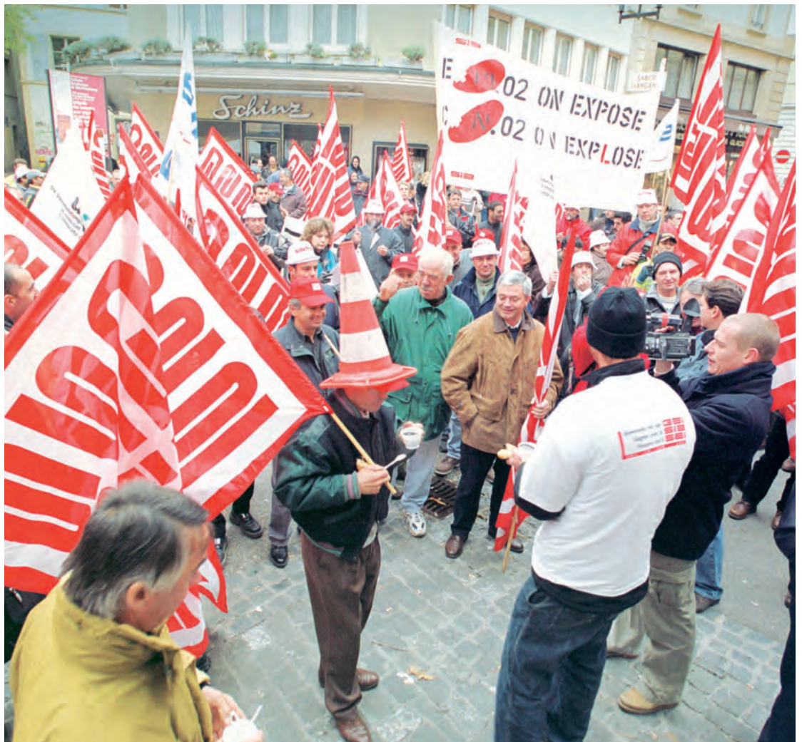
Protestdemonstration für das Rentenalter 60 in Neuchâtel, 19. November 2001.

(Das Gespräch fand am 22. Januar 2015 in Aarau statt.)