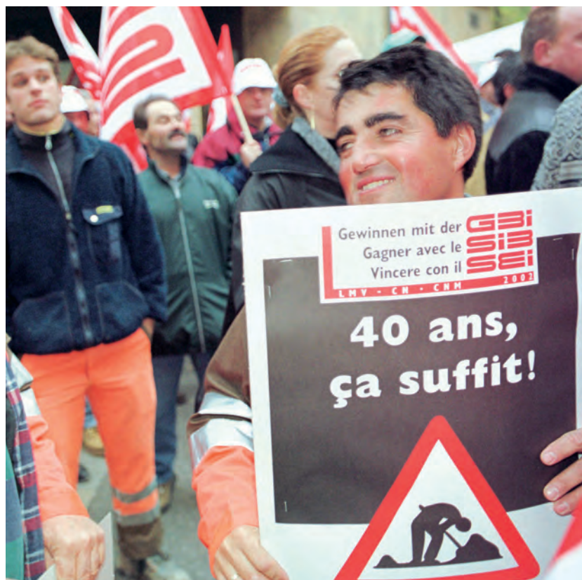
40 Arbeitsjahre genügen: Protestaktion in Neuchâtel, 19. November 2001.

Nach zehnjähriger Aufbauarbeit waren in den drei Verwaltungsstellen der Stiftung gesamthaft mehr als 35 Personen tätig. Jährlich werden heute mehr als 1300 Rentengesuche beurteilt und monatlich über 5000 Renten ausbezahlt. Dafür werden über 330 Millionen Franken Beiträge bei über 4200 Betrieben mit rund 80 000 Mitarbeitern eingezogen. Das Anlagevolumen beträgt heute knapp 900 Millionen Franken.