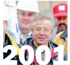
16. Dezember 2001: Die Berufskonferenzen Bau von GBI und Syna lehnen ein letztes Angebot der Baumeister für den neuen LMV ab. Die GBI trifft konkrete Vorbereitungen für den vertragslosen Zustand ab April 2002.

Scheidegger: Der erste Schock für uns war, als bekannt wurde, wen die Baumeister in den Stiftungsrat schickten. Sie haben die Hardliner entsandt, jene, die alles daran gesetzt hatten, den Abschluss zu verhindern. Am Anfang dachten wir, dass das nicht gut herauskommen würde. Gleichzeitig hatten wir aber vertraglich alles konkret und genau abgemacht, sodass relativ wenig Spielraum bestand und wir nur noch umsetzen und nichts mehr verhandeln mussten. Das war ein zentraler Punkt. Wir hatten auch die Aufgabenteilung bei