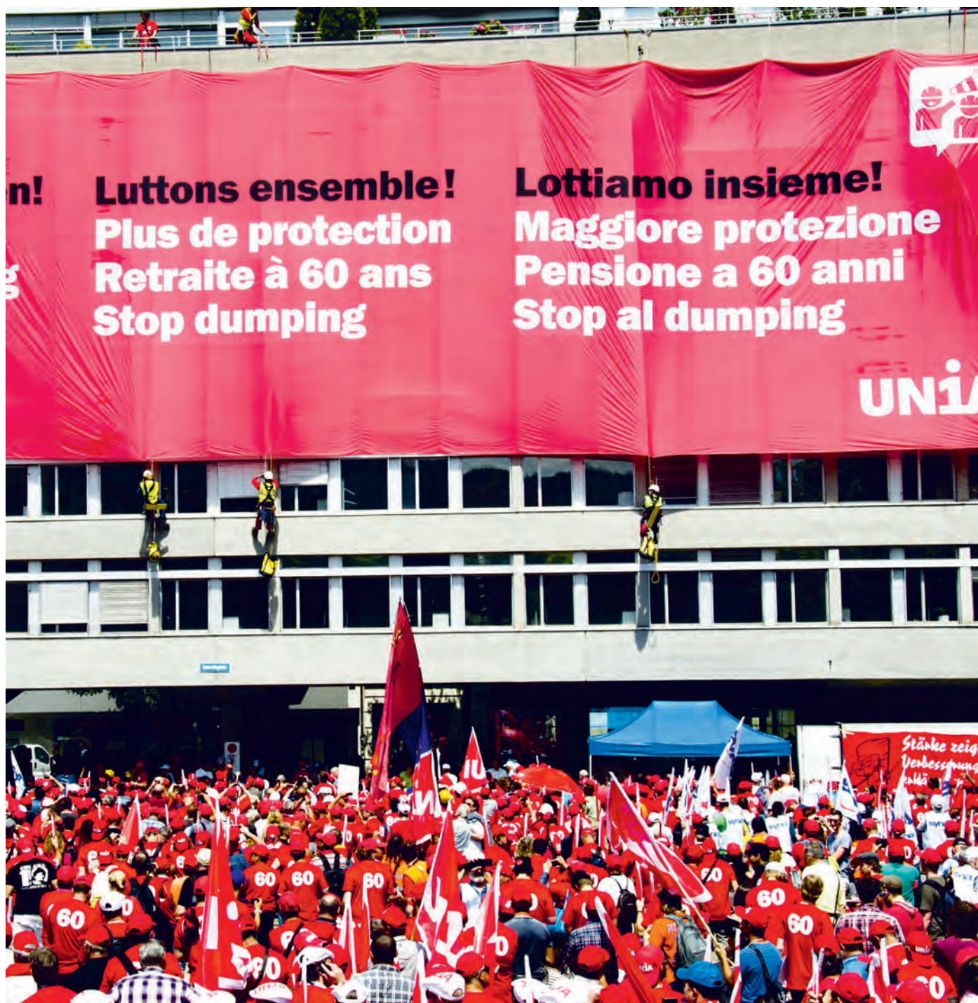
Nationale Baudemo in Zürich, 27. Juni 2015.

Dreizehn Jahre nach dem erfolgreichen Kampf für die Rente mit sechzig stehen die Bauarbeiter also wieder am Ausgangspunkt. Sie werden ihre Errungenschaft verteidigen. Wie gesagt: wenn nötig auch mit Streik.