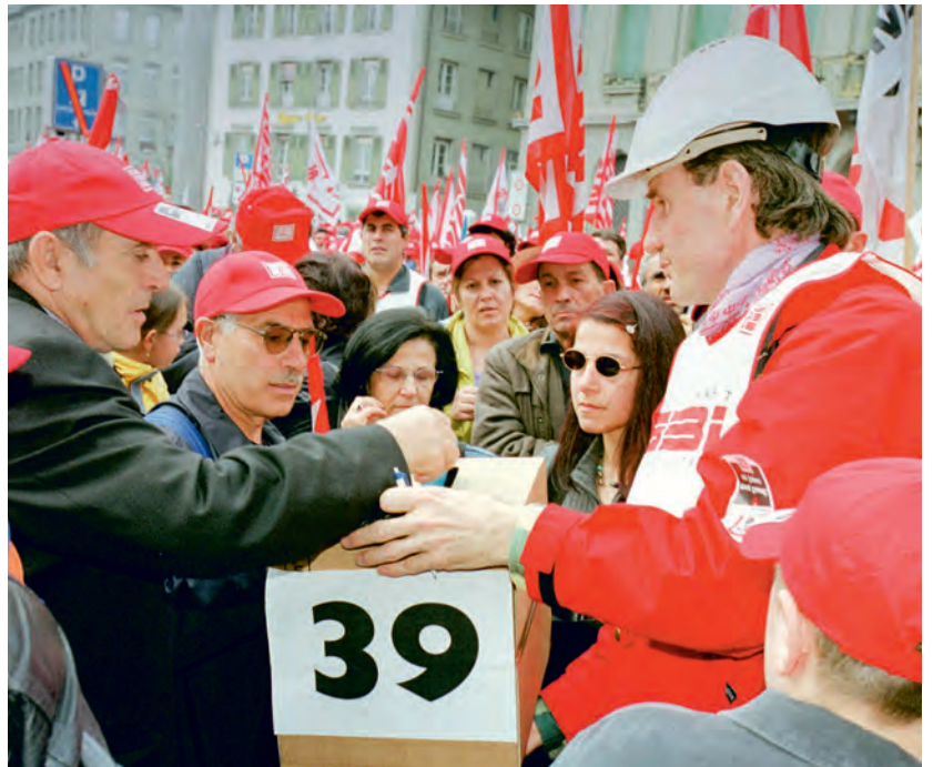
Urabstimmung an der nationalen Demo in Bern, 16. März 2002.

Burger: Ein Stück weit war es vielleicht die Verwegenheit der Jugend, ich war damals 24 Jahre alt! Im Nachhinein wird mir fast etwas unwohl dabei ... Wie gesagt, wichtig war die Erfahrung bei der Zentralwäscherei Basel zwei Jahre früher. Dort schien die Situation am Anfang total aussichtslos, der VPOD hatte schon aufgegeben, und wir führten die Kampagne – es ging um eine Lohnsenkung – mehr als ein Jahr lang. Damals hatte ich den glei-