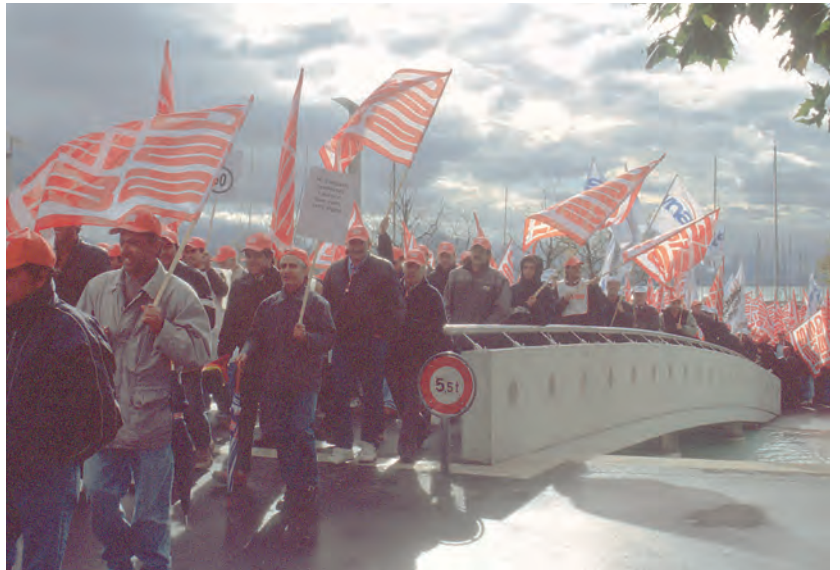
Kundgebung in Lausanne, 4. November 2002.

D'Incau: Ja, sie sind durch den Tunnel gegangen. Wir, das heisst, fünf bis sechs Personen waren gerade dabei, auf der anderen Seite grosse Transparente aufzuhängen. Da kamen auch von der Berner Seite her Cars mit Leuten. Sie fuhren langsam und hielten an. Die Leute stiegen aus und liefen in den Tunnel hinein. Ich muss sagen, das werde ich in hundert Jahren nicht vergessen. Im Zelt war man ahnungslos. Oder hast du gewusst, dass man die Autobahn sperren wollte?