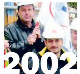
27. Juni 2002: Kehrtwende beim SBV. Die Delegierten der Baumeister lehnen an ihrer DV den ausge- handelten GAV mit Ren- tenalter 60 offiziell ab.

«Wir wussten ja damals nicht genau, wie viel Kampfkraft wir tatsächlich hatten, also mussten wir eine grosse Stärke zumindest demonstrieren. Die Symbolik war gut. Medial wurde die Baregg-Blockade ein unglaublicher Erfolg.»