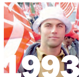
1993: Die DV des SBV (Schweizerischer Bau- meisterverband) lehnt ein bescheidenes Modell für Teilpensionierungen ab, es wäre durch ein Prozent Lohnabzug finanziert worden.

Im März und April 2001 führte die GBI im Hinblick auf die anstehenden LMV-Verhandlungen auf den Baustellen der gesamten Schweiz eine breit angelegte Umfrage durch, um herauszufinden, welches die wichtigsten Forderungen und Wünsche der ArbeitnehmerInnen waren. An der Umfrage beteiligten sich über 4000 Beschäftigte. Hinsichtlich der Prioritätensetzung brachte die Untersuchung ein klares Resultat: Fast 60 Prozent bezeichneten die frühzeitige Pensionierung als dringendste Forderung auf dem Bau, 28 Prozent plädierten vor allem für mehr Lohn, und nur je knapp 7 Prozent gaben mehr Ferien und der Abschaffung der Gleitstundenregelung den Vorrang. Der von den Delegierten der nationalen Berufskonferenz des Baugewerbes Mitte Mai 2001 beschlossene Forderungskatalog enthielt neben dem Rentenalter 60 allerdings noch ein ganzes Bündel weiterer Massnahmen. Die Konzentration eines solchen Katalogs auf die wesentlichen Forderungen ist für die Bewegungsführung in jedem Verhandlungsprozess eine grosse Herausforderung. Es gilt dabei zu vermeiden, dass sich unterschiedliche Gewichtungen zu einer Spaltung ausweiten oder verfestigen. In den Rezessionsjahren seit 1992 führte die Bewegungs- und Verhandlungsdynamik meist dazu,