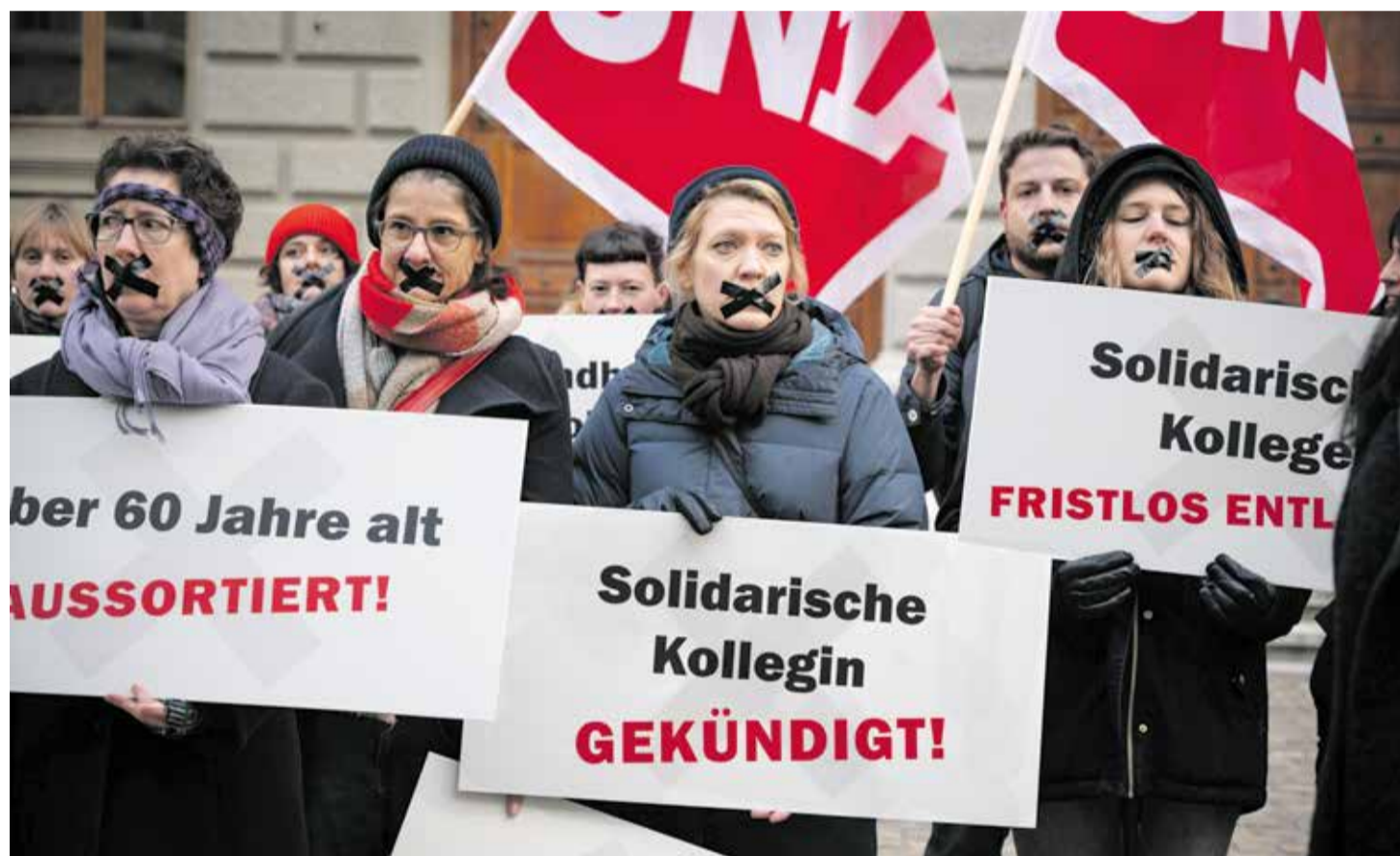
Hay que aumentar la protección frente a los despidos abusivos.

Un dato interesante: Suiza salió de la lista negra de la OIT porque se comprometió a llevar a cabo una mediación. Queda por ver si Suiza volverá a entrar en la lista negra.