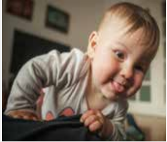
CUIDADO DE LOS HIJOS: Reglas especiales en caso de desempleo.

El seguro de invalidez ha concedido a mi marido una pensión de incapacidad parcial. La misma no es suficiente para mantener a nuestra familia de cuatro miembros. Desde que nació mi primer hijo -ahora tengo dos, uno de un año y otro de tres-, no he vuelto a trabajar. Estoy buscando trabajo, hasta ahora sin éxito. Como no tenemos suficiente dinero, he acudido a los servicios sociales del ayuntamiento. La trabajadora social me ha aconsejado que me inscriba en el RAV-ORP-URC para poder cobrar la prestación por desempleo mientras busco trabajo. ¿Tengo derecho a la prestación por desempleo aunque no haya trabajado desde 2020?