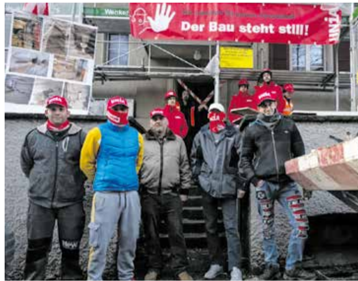
Tras la paralización del trabajo recibieron el salario.

El pasado mes de diciembre las/los secretarías sindicales del Unia constataron, en una visita rutinaria, que varios trabajadores húngaros no solo trabajaban en la obra, sino que también vivían allí: dormían en colchones sin sábanas tirados en el suelo, con instalaciones sanitarias inmundas, al lado de una caldera de agua y una ducha improvisada, entre paredes medio derruidas. Y ello, desde mediados de noviembre. El sindicato Unia reaccionó de inmediato y alojó a los cinco trabajadores en un hotel para sacarlos de estas condiciones antihigiénicas y degradantes y darles un alojamiento decente.