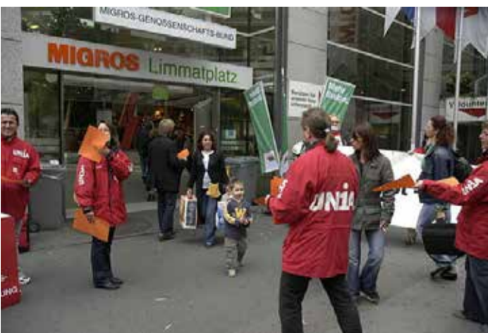
El Unia apoya al personal del Migros

El Grupo Migros sigue aumentando sus ventas de forma significativa, pero ejerce cada vez más presión sobre su plantilla. Estos buenos resultados de explotación deben traducirse en un aumento de los salarios y de la plantilla. Mientras el Grupo Migros anuncia elevadas cifras de ventas, la presión sobre el personal es cada vez mayor. Migros se niega a dialogar. El Unia exige que los buenos resultados empresariales se trasladen al personal.