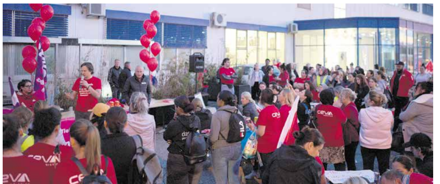
La determinación y la unión del personal ha dado sus primeros frutos.

En otoño de 2023, el personal del turno de mañana organizó una protesta para reforzar sus reivindicaciones. Cuando amenazaron con una huelga de advertencia, CEVA cedió y concedió, finalmente, algunas mejoras. El Unia pide a la empresa que se siente ahora a la mesa, con las/los representantes del personal, para negociar sobre las reivindicaciones del personal pendientes y buscar una solución.