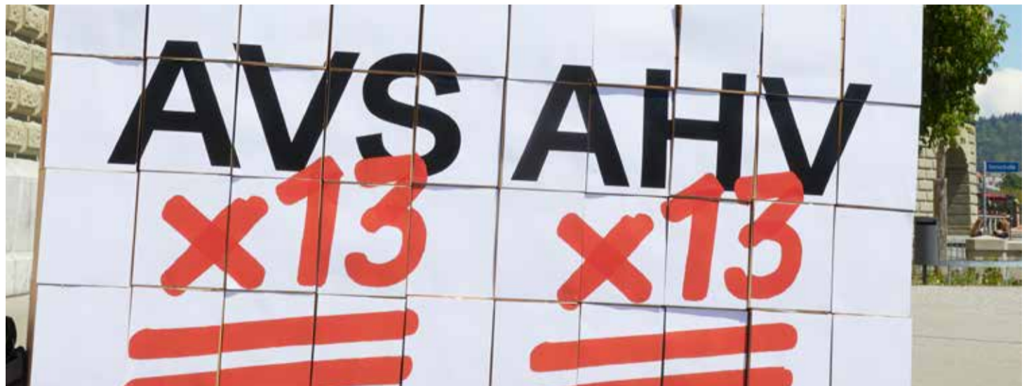
La introducción de una 13ª pensión del AHV-AVS21 es un primer paso para reforzar las pensiones del primer pilar. Por ello: ¡Sí a la iniciativa AHV-AVS x 13!

Información detallada se puede obtener en las Cajas de compensación.