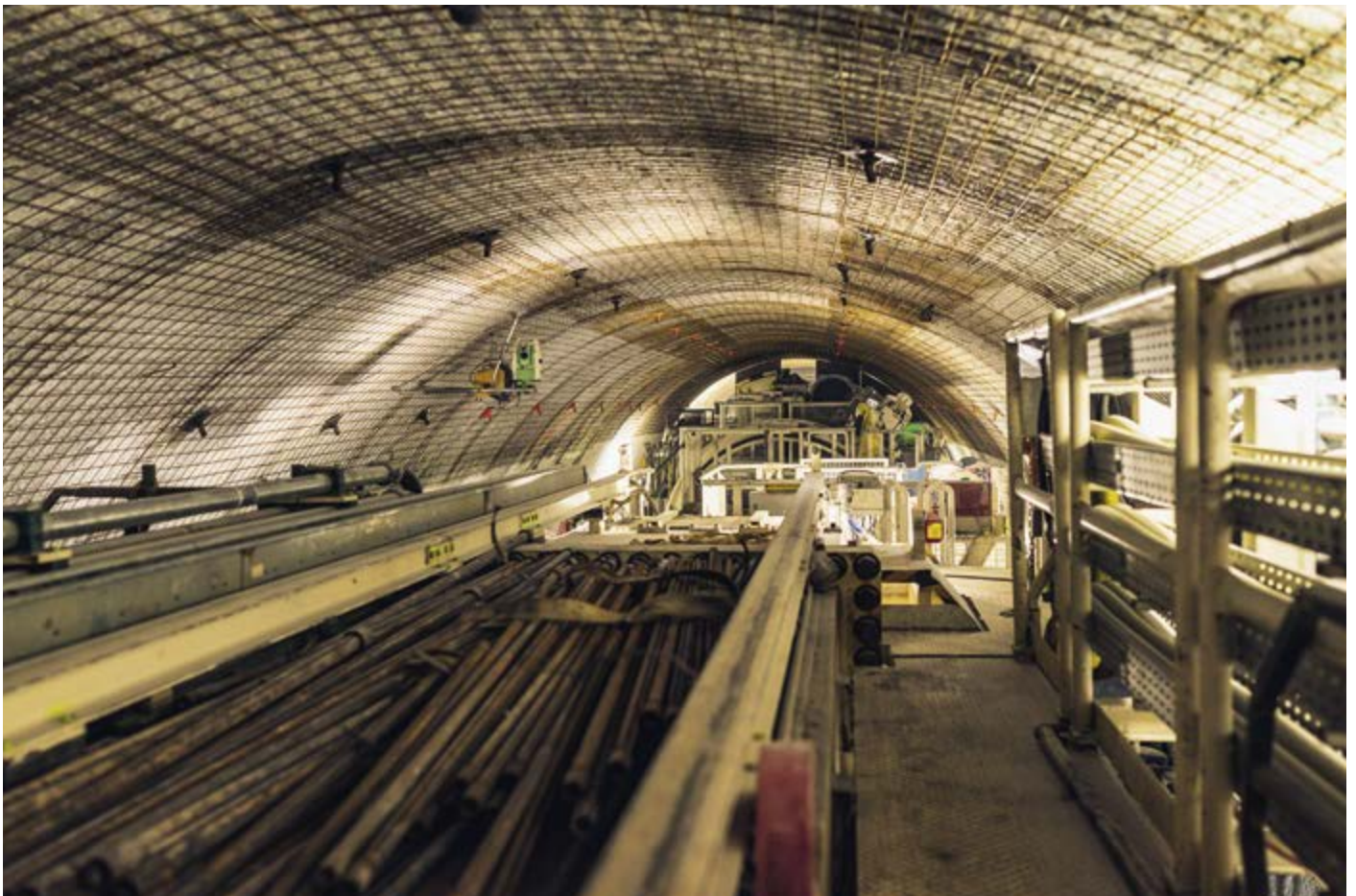
Sur le «toit» du tunnelier, les mineurs sécurisent la voûte du tunnel avec des ancrages et des fers d'armature.