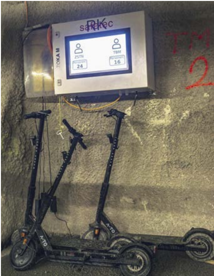
La sécurité est une priorité: l'écran indique le nombre de personnes qui se trouvent dans le tunnel et combien sont sur le tunnelier. Les trottinettes sont réservées à la DT et aux contremaîtres.