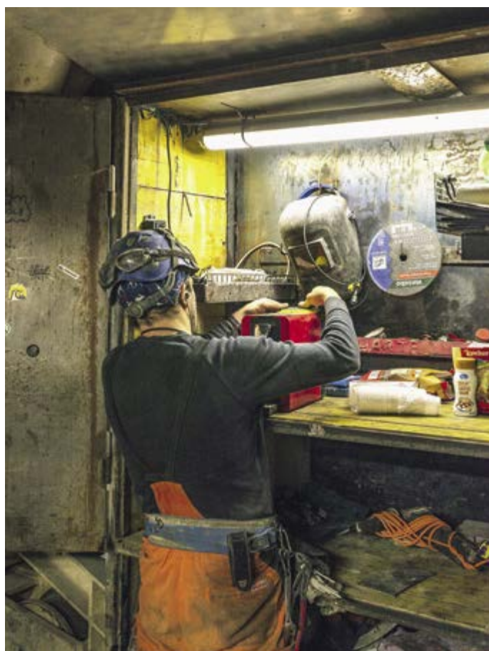
Des courtes pauses sont aussi prévues : sur la foreuse, les mineurs ont installé un petit bar à café.