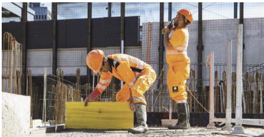
Du respect pour un dur labeur: les ouvriers du bâtiment et les contremaîtres ont pu reconduire la CN avec quelques améliorations.

Les négociations n'ont pas abouti à une solution sur plusieurs thèmes, notamment la question des temps de déplacement ou celle des intempéries. Toutefois, un groupe de travail aura pour tâche de se pencher dans les 2 prochaines années sur ces questions, ainsi que sur la revalorisation de la branche pour faire face à la pénurie de main d'œuvre.