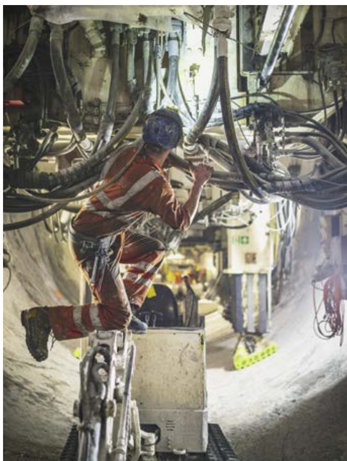
Un homme très sollicité : avec le mécanicien, l'électricien veille au bon fonctionnement du TBM.