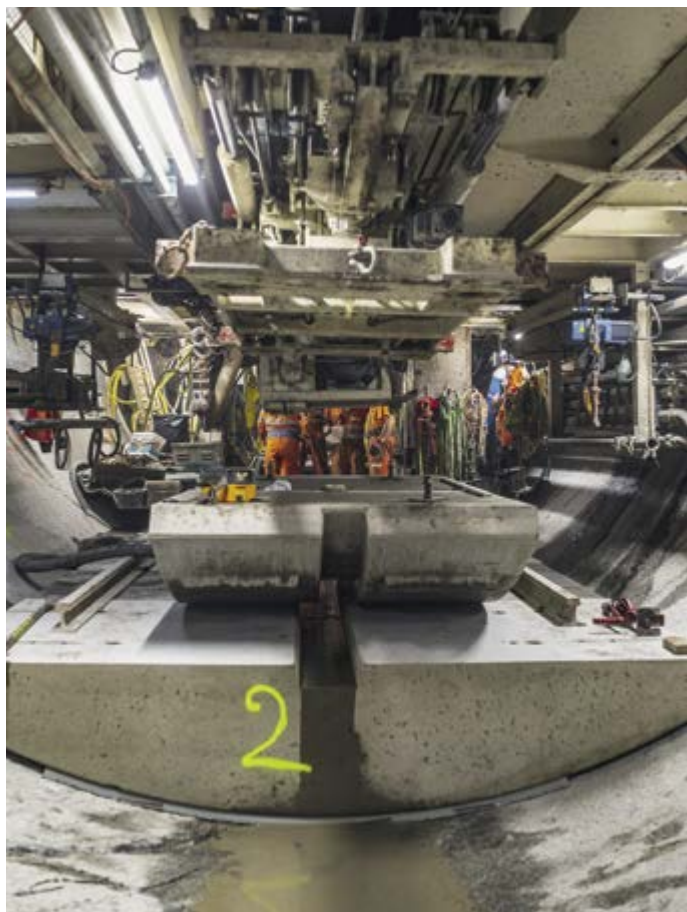
Travail de précision : le sol du tunnel foré est recouvert de voussoirs préfabriqués et les rails sont posés pour le TBM.