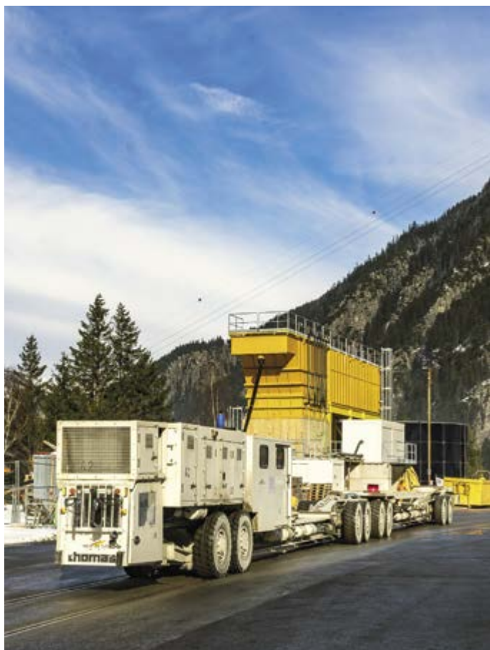
Huit essieux et quarante mètres de long: le véhicule multi-services (blanc) permet d'approvisionner le chantier du tunnel sans rails. Les ouvriers l'utilisent aussi pour se rendre dans la montagne.

Derrière la tête de forage, le tunnelier se compose de onze «trains suiveurs» avec toutes sortes d'installations et d'appareils techniques, de câbles et de tuyaux, de pompes et de convoyeurs à bande, de réservoirs et de compresseurs et d'un centre de commande équipé de nombreux écrans. Un système de navigation moderne permet à la machine de toujours avancer dans la bonne direction. À partir des «trains suiveurs», les ouvriers sécurisent la section de tunnel excavée à l'aide d'ancrages et d'un robot pour le béton projeté. «Notre TBM est une véri-