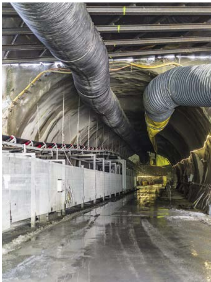
Entrée de la galerie d'accès nord: un tube de départ a d'abord été creusé à l'explosif, puis le tunnelier est entré en action. À gauche, le dépôt du convoyeur à bande qui s'allonge avec le tunnel.