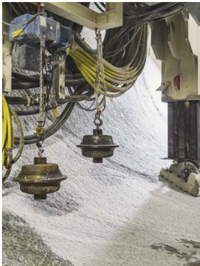
Du métal dur contre la roche dure : deux burins pesant chacun 240 kilos attendent d'être fixés sur la tête de forage.