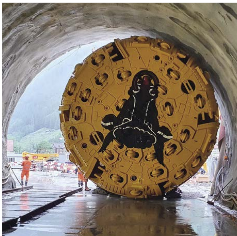
Un mastodonte : la tête de forage a un diamètre de 7 mètres et est équipée de 42 molettes qui broient la roche.

La galerie d'accès devrait être terminée au milieu de l'année et l'excavation des zones de perturbations pourra alors commencer. La principale excavation pour le deuxième tube routier est prévue pour l'été 2024. Deux foreuses encore plus grandes, d'un diamètre de 12,3 mètres, placées au nord et au sud perceront ensuite chacune la moitié du tunnel de près de 17 kilomètres de long. Le contremaître Daniel Lanz sera à nouveau présent.