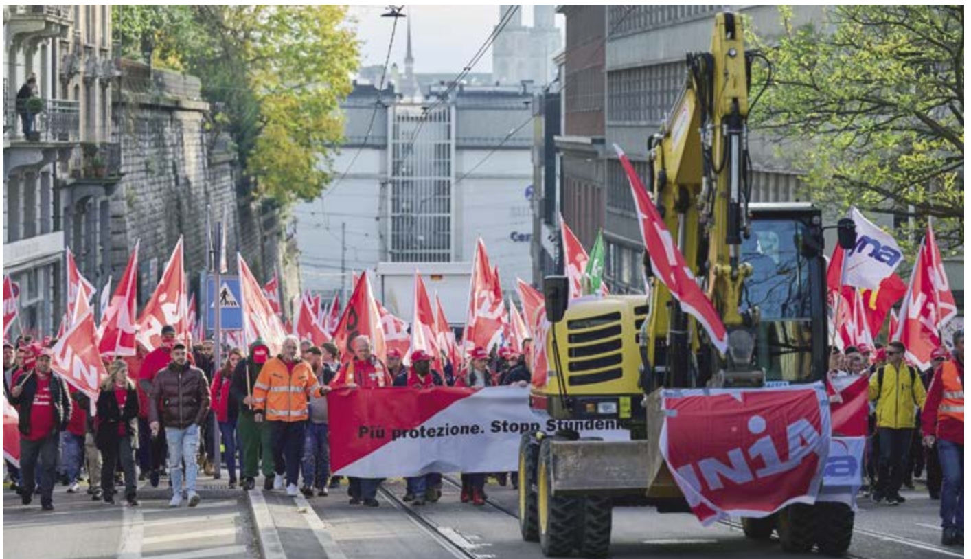
«Pas touche à notre temps de travail»: 15 000 travailleurs de la construction ont clairement rappelé qui construisait la Suisse.