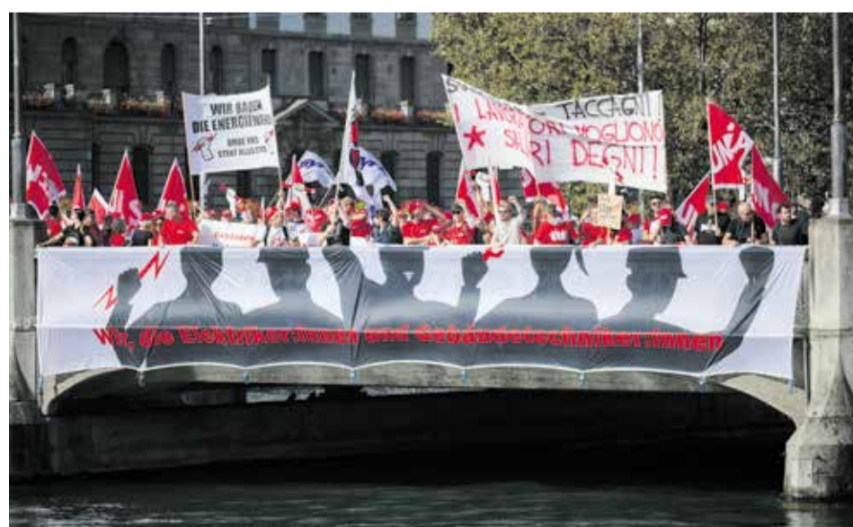
Electricistas y técnicos/as de edificios luchan por mejores condiciones laborales

Las y los manifestantes entregaron estas reivindicaciones, en forma de dos peticiones, en las respectivas sedes nacionales de las asociaciones patronales EIT.Swiss (electricidad) y Suissetec (técnica de edificios). Las 7883 firmas recogidas y la manifestación de octubre demuestran claramente que ahora la pelota está en el tejado de ambas patronales.