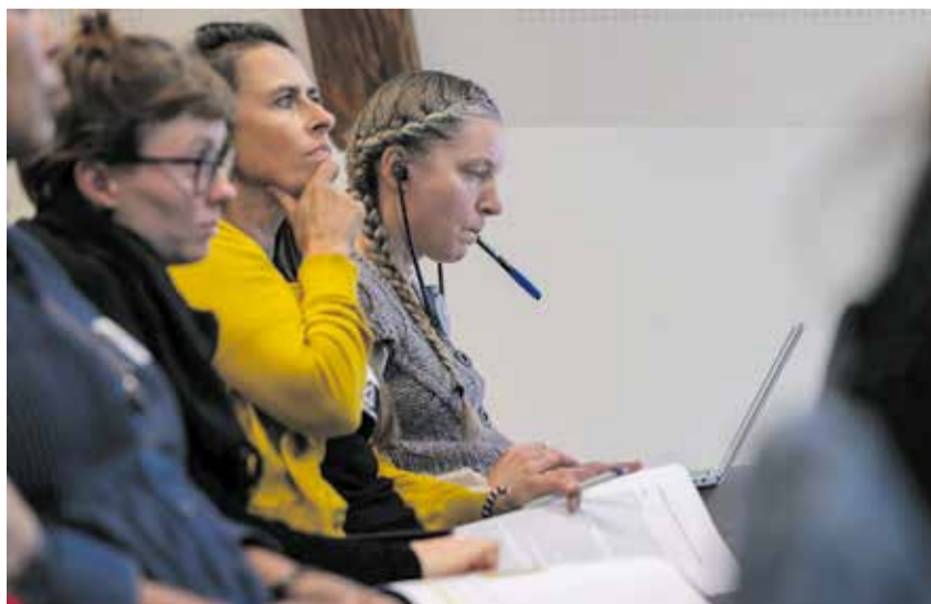
La participación como instrumento fundamental para combatir la precariedad y el racismo.

El desmantelamiento de los derechos fundamentales de las personas migrantes solo puede frenarse si unimos nuestras fuerzas. Esta conferencia ha sido un buen comienzo para movilizar a toda la población suiza en favor de una mayor participación. Tras este exitoso comienzo, el objetivo es que la Conferencia de migrantes se amplíe y contribuya a la aplicación de una política de migración solidaria en Suiza.