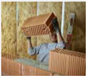
ESPALDA ROTA: Cuando debido a una hernia discal el trabajo en la construcción ya no es posible, hay que cambiar de profesión

Llevo 15 años trabajando como albañil para una empresa de construcción. El trabajo es físicamente duro. Desde hace años tengo dolores de espalda. Hace unos meses tuve una hernia discal y desde entonces no puedo trabajar. Cobro prestaciones del seguro de indemnización diaria por enfermedad. Ahora me han escrito diciéndome que van a dejar de pagarme porque, según el informe de su médico, puedo trabajar a tiempo completo en otra actividad en la que no tenga que levantar pesos. Mi propio médico opina lo mismo. No obstante, ¿puede el seguro de indemnización diaria por enfermedad dejar de pagarme de un día para otro?