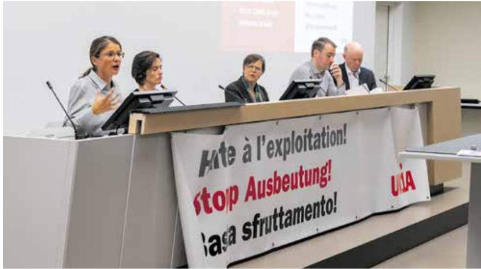
Berna, 23.10.23: Un momento del simposio contra la trata de seres humanos.

Lo que puede parecer extraño a primera vista es, desgraciadamente, cierto: la trata de seres humanos también tiene lugar en Suiza y el número de casos denunciados sigue aumentando. El Unia, consciente de su papel en la lucha contra esta lacra, participa en el tercer Plan de Acción Nacional contra la Trata de Seres Humanos (2023–2027) como interlocutor social. El 23 de octubre se celebró en la sede del Unia, en Berna, un simposio contra la trata de seres humanos con fines de explotación laboral.