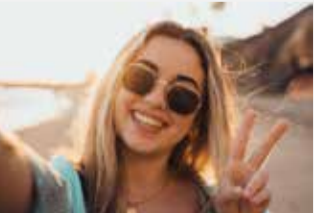
MERECIDAS VACACIONES: En el caso del trabajo a tiempo parcial, el salario durante las vacaciones no siempre es calculado de manera correcta.

En mi primer contrato de trabajo se acordó un porcentaje de trabajo de, al menos, el 40%. El año pasado, firmé un segundo contrato de trabajo aceptando una carga de trabajo adicional variable. Ahora trabajo una media de un 60% con un salario por hora de 27 francos. En el salario-hora no se incluye la indemnización por las vacaciones. ¿Tengo derecho a que me paguen durante las vacaciones el salario correspondiente al 60% que trabajo de media?