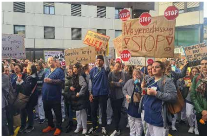
Acto de protesta del personal del Hospital Cantonal de San Galo

El 23 de octubre, trabajadoras y trabajadores del hospital de San Galo se concentraron a la entrada del hospital cantonal para protestar contra la supresión de 440 puestos de trabajo. Las trabajadoras y trabajadores aplaudieron durante exactamente 4 minutos y 40 segundos en protesta por la supresión masiva de puestos de trabajo. Contrariamente a las declaraciones de la dirección del hospital a los medios de comunicación, también se suprimirán 120 puestos de trabajo de enfermería. Con su acción de protesta frente al hospital cantonal de San Galo, el personal apela al Consejo Cantonal y al gobierno cantonal a que asuman la responsabilidad por esta desastrosa evolución y se hagan cargo del déficit financiero. La dirección del hospital debe detener inmediatamente cualquier tipo de desmantelamiento de puestos de trabajo y anular los despidos. El personal también hace un llamamiento a la dirección del hospital para que se busquen soluciones sostenibles, de manera que los hospitales de San Galo sigan siendo un empleador atractivo.