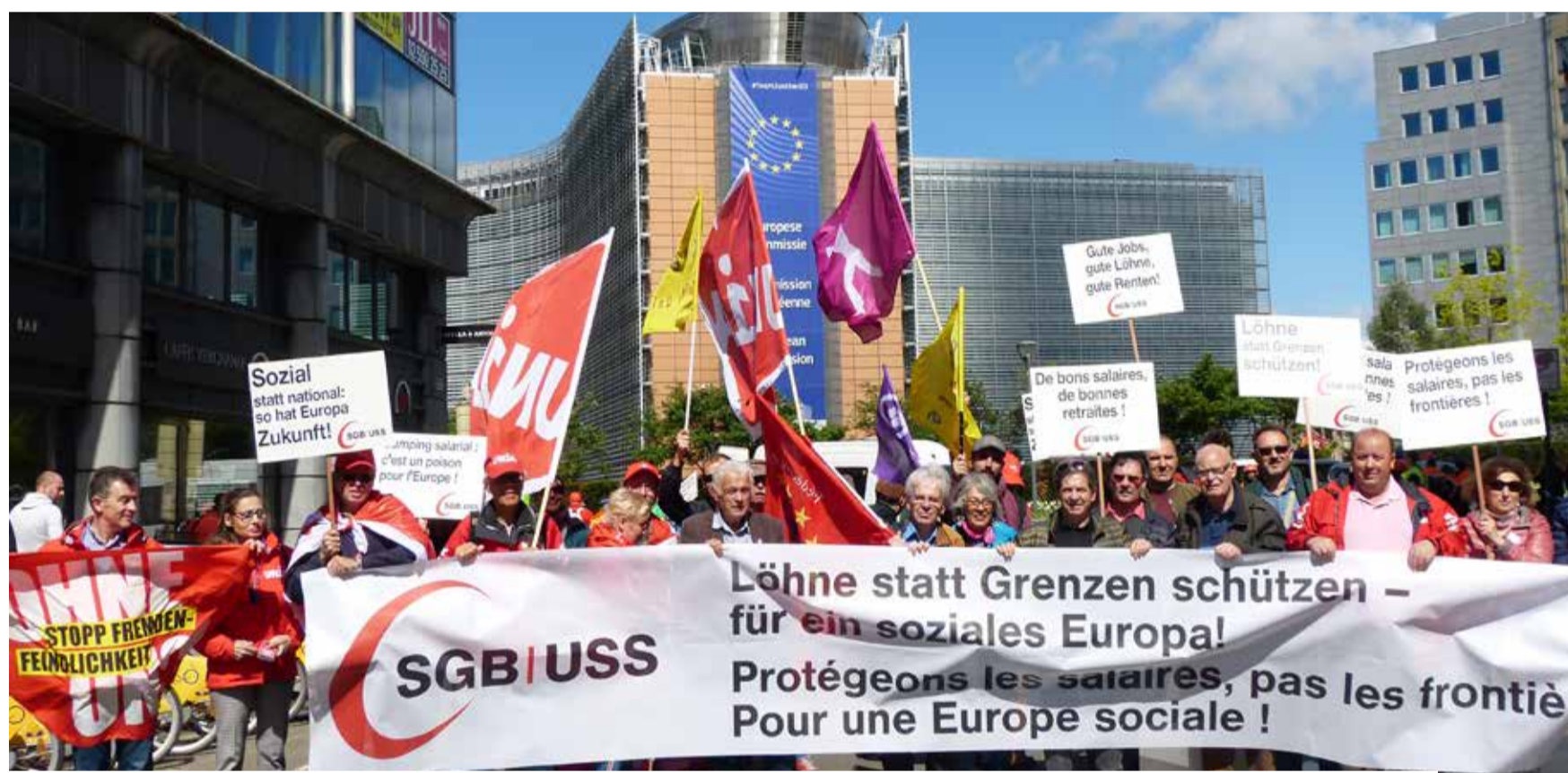
Solidarizimi i sindikalistëve zviceranë me demonstratën e Bashkimit të Sindikatave të Evropës para Komisionit Evropian me 26 prill 2019 në Bruksel

Lëvizja e lirë e personave me BE-në për punëdhënësit ka qenë një përparim i rëndësishëm, i cili u ka dhënë atyre më shumë të drejta. Mirëpo, kjo duhet të ndërlihet me mbrojtje efikase të pagave. Marrëveshja e paraqitur kornizë me BE-në tenton të tërheqë mbrojtjen e pagave – Unia kundërshton diçka të tillë.