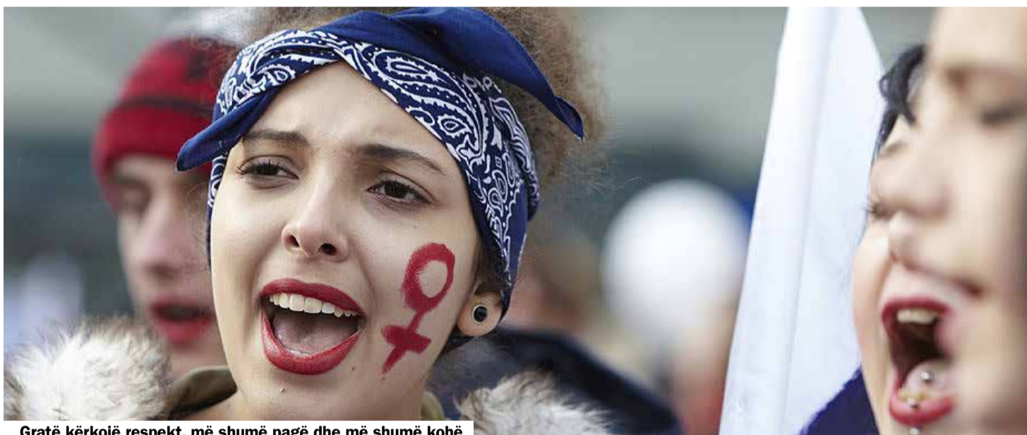
Gratë kërkojnë respekt, më shumë pagë dhe më shumë kohë