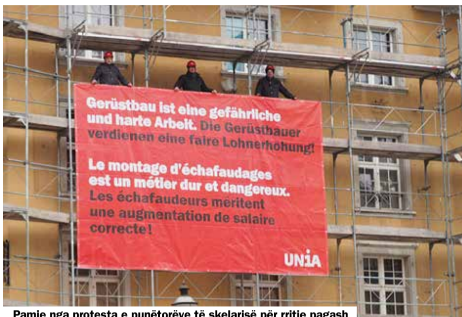
Pamje nga protesta e punëtorëve të skelarisë për rritje pagash

Rreth 2850 punëtorë skelarie nga 1 prilli marrin një rritje të përgjithshme pagash. Pos tjerash do të rriten edhe pagat e tyre minimale. Këto ata i kanë merituar. Unia ka kohë që angazhohet për kushte të mira pune në skelari ndër-timtarie. Kështu që nga 2015 – sikur në foto – me një aksion për rritje korrekte të pagave.