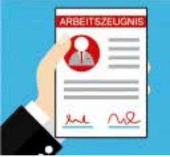
NEDEN YOK: Ara referans mektubu istiyorsanız, patronunuza nedenini söylemek zorunda değilsiniz.

Annem on yıldır aynı şirkette çalışıyor ve kariyerini geliştirmek istiyor. Şimdi bu isteğine uygun bir iş ilanı gördü. Ancak, başvurusu için mevcut işvereninden geçici bir referans mektubuna ihtiyacı var. Buna hakkı var mı?