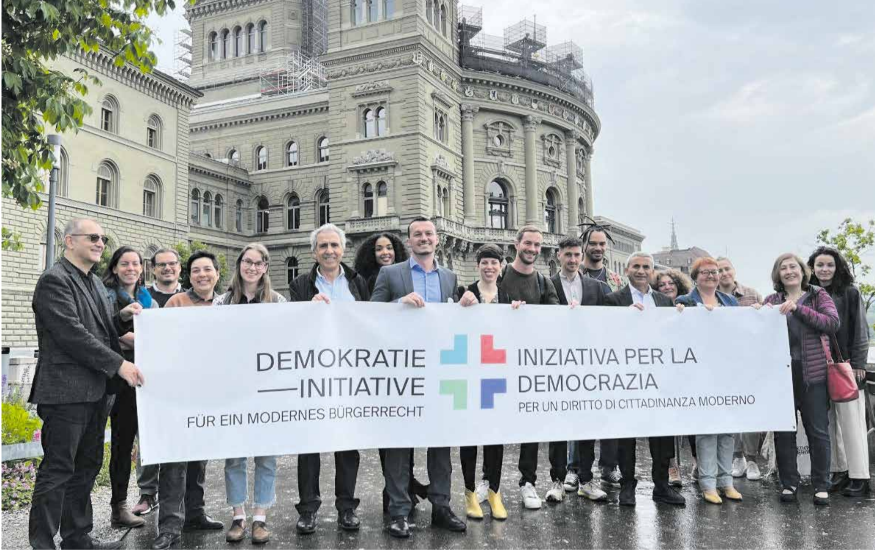
Parlamento'ya Vatandaşlık Yasası'nın değiştirilmesi için verilen önerileri reddetti. Demokrasi inisiyatifi değişim için mücadele ediyor.

Parlamento'da Vatandaşlık Yasası'nın değiştirilmesi için birço önerge verildi. Bunların hepsi sağcı partiler tarafından reddedildi. Önergeleri sadece Sosyal Demokrat Partisi, Yeşiller ve Yeşil Liberaler desteklediler. Parlamento Yasa'nın değişmesini istemiyor. Bu durumda Vierviertel Derneği'nin Vatandaşlık Yasası'nı değiştirme girişimi daha da önem kazanıyor. Bu girişim için 100 000 imzaya ihtiyaç var ve ardından halk oylamasına sunulacak.