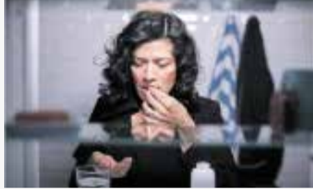
Şefler çalışanların istekleri dışında sağlık memuruna gönderebilir.

Beş haftadır hastayım. Şefime her hafta, bir hafta daha çalışamayacağımı belirten bir doktor raporu verdim. Şimdi şefim güvenilir bir doktor tarafından muayene edilmemi istiyor. Geçenlerde beni Aare nehri boyunca yürürken görmüş ve hasta görünmüyordum. Bunun benim özeline bir saldırı olduğunu düşünüyorum. Benden başka bir doktor tarafından muayene edilmemi isteyebilir mi?