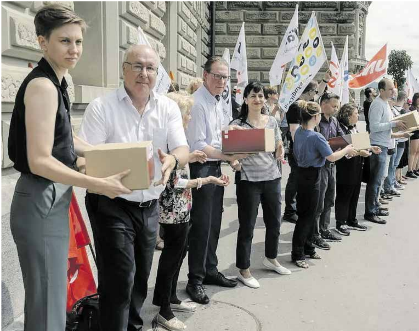
BVG/LPP 21'e karşı referandum: 140 000 kişi emeklilik fonu kesintilerine karşı imza verdi. Unia, kötüleştirme planlarına karşı mücadele başlattı.

referanduma gidilecek ve HAYIR oyunun daha fazla olması gerekiyor. BVG reformu muhtemelen 3 Mart 2024 tarihinde oylamaya sunulacak.