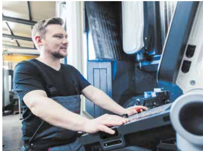
Mücadele sonuç verdi: Çalışanların ücreti artıyor. Sanayide çalışma saatlerinin kötüleşmesi önlendi ve toplu iş sözleşmesi beş yıl daha uzatıldı.

Bu durumda, sözleşme tarafları mevcut TIS-MEM'i Haziran 2028'de yenilemeyi kabul etti. TIS MEM, asgari ücretlerin enflasyona göre otomatik olarak ayarlanması, haftalık çalışma saatinin 40 olarak kalması, en az beş haftalık tatil, 13. aylık ve personel komisyonuna kararlara katılım hakkı gibi temel kriterleri içeriyor.