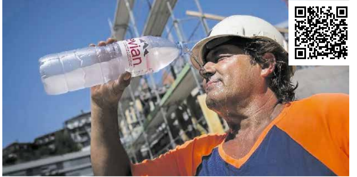
Kötü hava koşullarında ve sıcaklarda işin durdurulması için yasa net kriterler belirlenmelidir. Unia bunun için iza kampanyası başlattı.

Bu dilekçeyi imzalayın ve mümkün olduğunca geniş bir çevreye yayın. Bu şekilde sonbaharda çok sayıda imza toplamış oluruz. Dilekçeyi burada bulabilirsiniz: www.unia.ch/de/kampagnen/bau-schlechtwetter-und-hitze