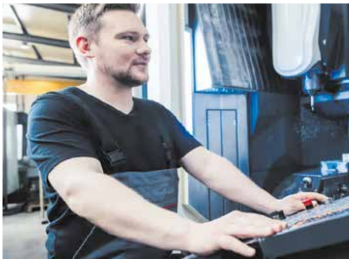
Kushtet më të mira pune në gastronomi e industri