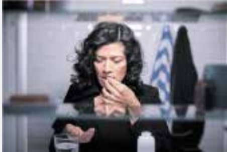
PILULË E HIDHUR: Shefat munden të dërgojnë punonjësit e tyre për ekzaminim tek mjeku i besueshëm.

Ka 5 javë që unë jam i sëmurë. Për çdo javë shefit tim ia kam dorëzuar nga një dëftese mjekësore, që dëshmon për paaftësinë time për punë në javën vijuese. Tani shefi im donë të më dërgoj për ekzaminim tek mjeku i besueshëm. Ai së fundi më ka parë duke shëtitur përgjatë lumit Aare, dhe me këtë rast nuk i jam dukur i sëmurë. Këtë unë e përjetoj si sulm në sferën time private. A mund ai të kërkojë nga unë, që të ekzaminohem nga një mjek që nuk e njoh?