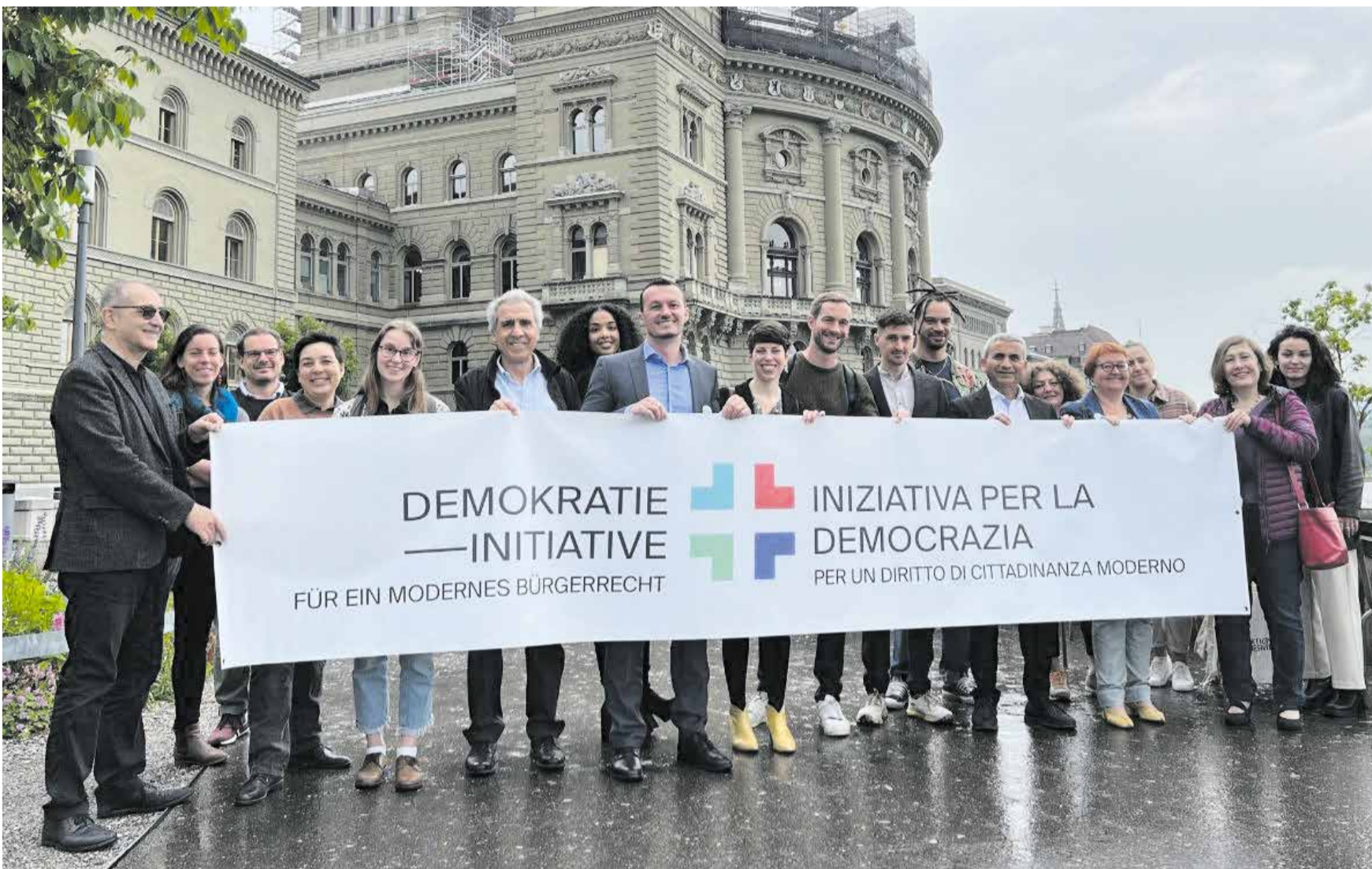
Pamje nga aksioni i "Nismës për demokraci" dhe iniciatorëve e mbështetësve të saj para pallatit federal të Zvicrës në Bernë

Janë paraqitur shumë parashtrës për rishqyrtimin e ligjit për shtetësi. Të gjitha këto u refuzuan nga shumica e djathtë në parlament. Për ish-in vetëm Partia Socialdemokrate (PS), të Gjellbrit dhe Liberalët e Gjellbër. Parlamenti nacional nuk dëshiron të ulë hendeqet. Kjo do të thotë se nisma e natyralizimit e shoqatës «Vierviertel» ka edhe rëndësi të madhe. Duhet 100 mijë nënshkrime dhe më pas populli mund ta votojë.