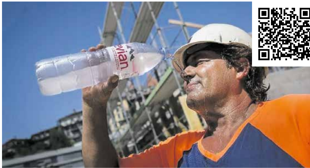
Vapa dhe moti i keq në ndërtimtari rrezikon shëndetin

Nënshkruaje këtë peticion dhe shpërndaje sa më gjerësisht të jetë e mundur. Kështu që ne në vjeshtë të mund të dorëzojmë shumë nënshkrime. Peticionin mund ta gjeni këtu: www.unia.ch/de/kampagnen/bau-schlechtwetter-und-hitze