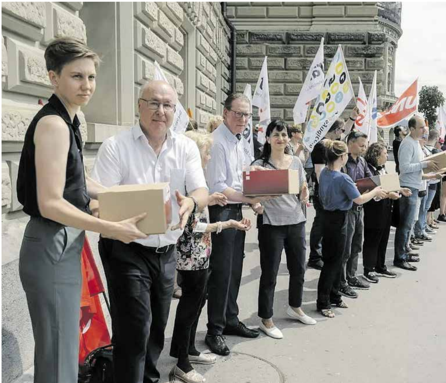
Dorëzimi i mbi 140 000 nënshkrimeve të mbeldhuara nga Unia dhe aleatët e saj për të kundërshtuar përqesimet.

Teorikisht, ligji i ri pas aprovimit duhet do të hyjë në fuqi më 1 janar 2025. Për ta parandaluar, duhet një JO në referendum. Për reformën e BVG në fjalë, sipas të gjitha gjasave, do të votohet më datën 3 mars 2024.