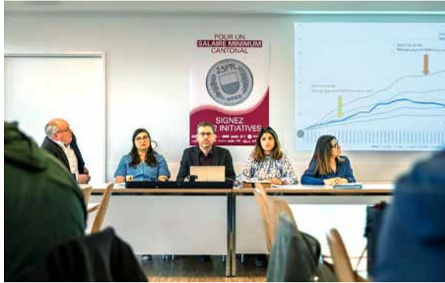
Pagat e detyrueshme minimale ka shanse edhe në Kantonin Vaud/Waadt

Paga minimale në Vaud/Waadt është pjesë e një përpjekjeje kombëtare për mbrojtjen e fuqisë blerëse të punonjësve. Pasi që një nismë e parë kantonale e vitit 2011 u refuzua me një dallim të vogël votash, kantonin Vaud/Waadt ka shanse të mira ti bashkëngjitet kantonëve të Gjenevës, Neunburgut, Juras, Bazel-qyteti dhe Tiçino, të cilat tanimë kanë pagën minimale kantonale të detyrueshme.