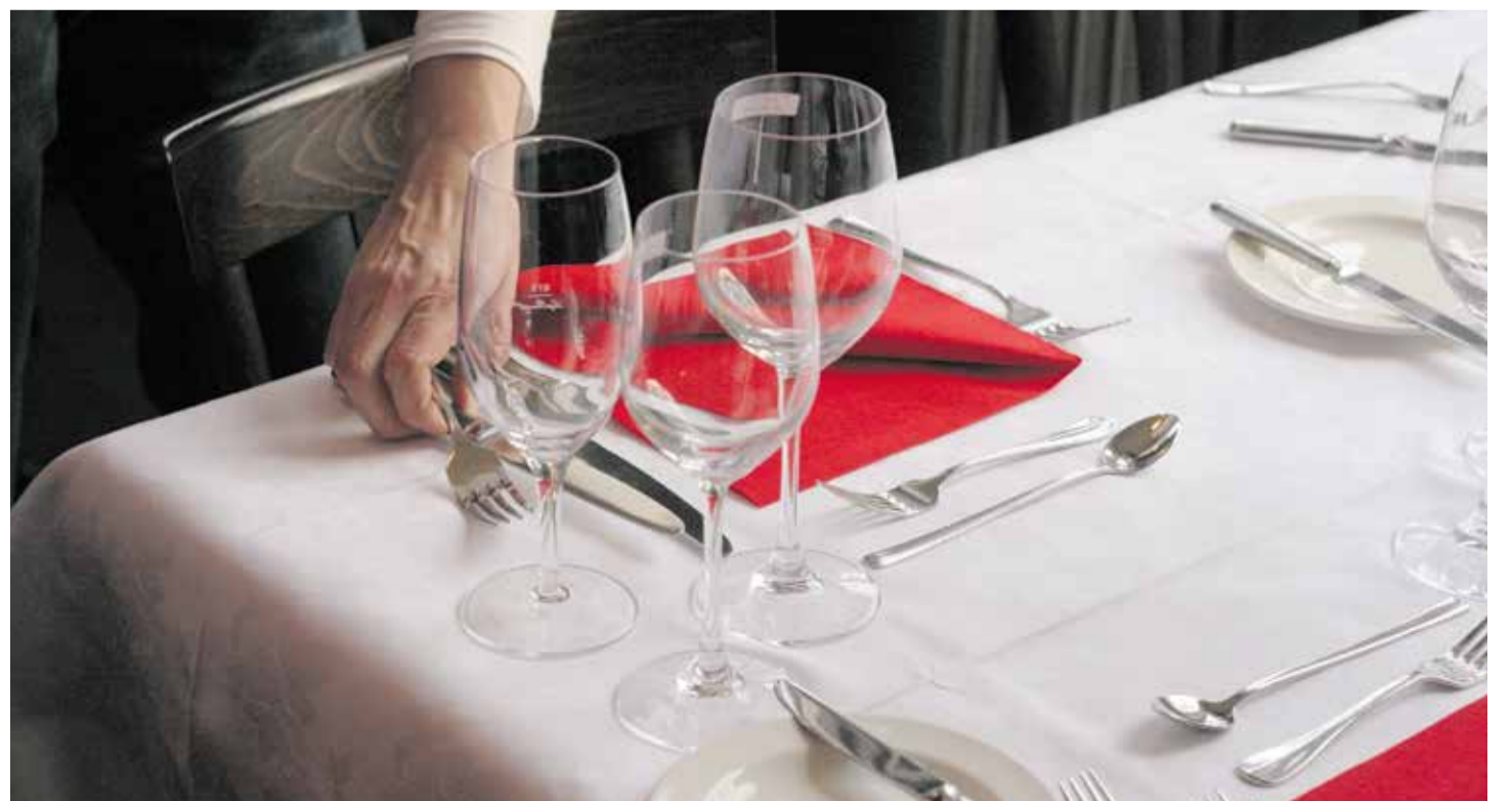
Të punësuarit në hoteleri e gastronomi përballen me ngacime seksuale, mobing, mungesë pauzash të mjaftueshme, pabarazi pagash, etj.

Në shkurt 2023 Unia ka dorëzuar manifestin e të punësuarve në gastronomi e hoteleri me mbi 10 000 nënshkrime shoqatës së punëdhënësve «GastroSuisse». Në te, të punësuarit ndër të tjera kërkojnë paga më të mira, planifikim me kohë të punës, pagesën e orëve të planifikuara, të drejtën për të mos qenë i arritshëm jashtë orarit të punës dhe masa efektive e preventive për mbrojtje të punëmarrësve nga ngacimet dhe mobingu. Është koha e fundit, që «GastroSuisse» ti nënshtrorhet përgjegjësisë.