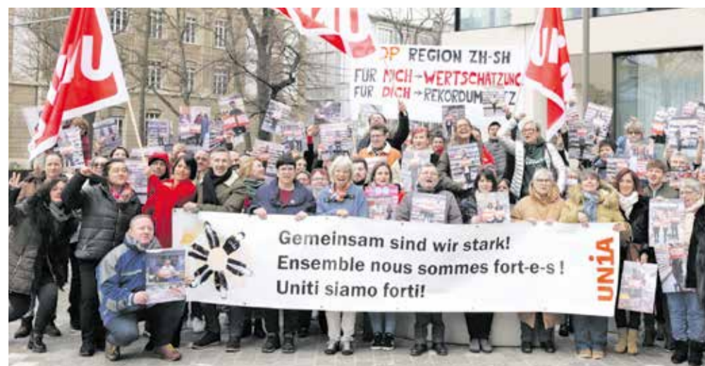
Samo zajedno možemo postići više

Sindikatu Unija je najjači ugovorni partner u kolektivnom ugovoru (GAV) za Coop. Unija i njeni aktivni članovi zaposleni u Coop-u zalažu se za poboljšanje uslova rada. Unija pomaže svojim članovima po svim pitanjima vezanim za radni odnos i podržava ih prilikom sprovođenja njihovih prava.