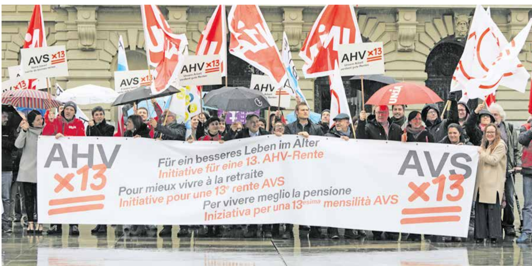
Promjena zakona o starosnom osiguranju ima ogroman uticaj na penzije

Novi Zakon o AHV-u stupa na snagu 2024. godine. Kao posljedica glasanja naroda izjednačena je starosna granica za penziju za žene i muškarce, te će žene morati da rade duže. I Zakon o penzionom osiguranju (BVG) predstavlja temu diskusije u parlamentu. Pritom se planiraju i dodatna ukidanja. Inicijativa sindikata za 13. AHV penziju sve je važnija kako bi se nadoknadili gubici na penzijama.