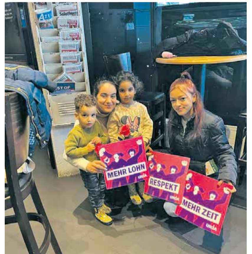
Veće plate, više respekta, više vremena

Događaji 8. marta uz moto Zajedno za bolje uslove rada u Bazelu, Bernu, Šo de Fonu, Delemonu, Friburu, Ženevi, Lozani, Lucernu, Nešatelu, Soloturnu, Sankt Gallenu, Vinterturu, Cirihu – dobar su početak za štrajk žena 2023.