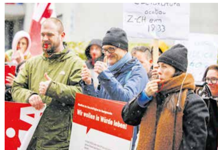
Za bolje uslove rada potreban je novi kolektivni ugovor

Lista potrebnih poboljšanja je obimna, ali veoma konkretna. Da bi se posao bolje organizovao i da bi se branša učinila prijemčivijom za nov kadar, moraju se poboljšati plate i povećati minimalci, platiti vrijeme potrebno za presvlačenje kao i planirani sati, a neophodno je i uzeti u obzir radno iskustvo prilikom određivanja visine plate. Pored toga potrebna je pravedna i transparentna podjela napojnica, planiranje radnog vremena bar tri sedmice unaprijed pismenim putem, kao i konačno ukidanje rada na poziv. Zaposleni u ugostiteljstvu žele da preduzeća investiraju u obuku zaposlenih zaduženih za osoblje,