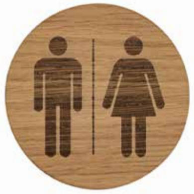
JASNO JE: Na poslu mora postojati dodatni WC. Za to mora da se pobrine šef.

Četiri puta sedmično držim četvoročasovne kurseve grnčarije. Uključujući pripremu i vrijeme potrebno za raspoređivanje, u koje spada i pečenje glinenih posuda, na poslu provedem oko šest sati. U zgradi u kojoj radim moraju da se renoviraju sanitarni čvorovi. To će trajati oko dvije sedmice. Sada su nas nastavnike obavijestili da tokom tog perioda nećemo moći da koristimo toalet. Predviđeno je da koristimo toalet na obližnjoj željezničkoj stanici. Međutim, da bismo tamo stigli potrebno je oko pet minuta, a ni sam toalet nije besplatan. Žene plaćaju dva franka. Smije li naš poslodavac to da radi?