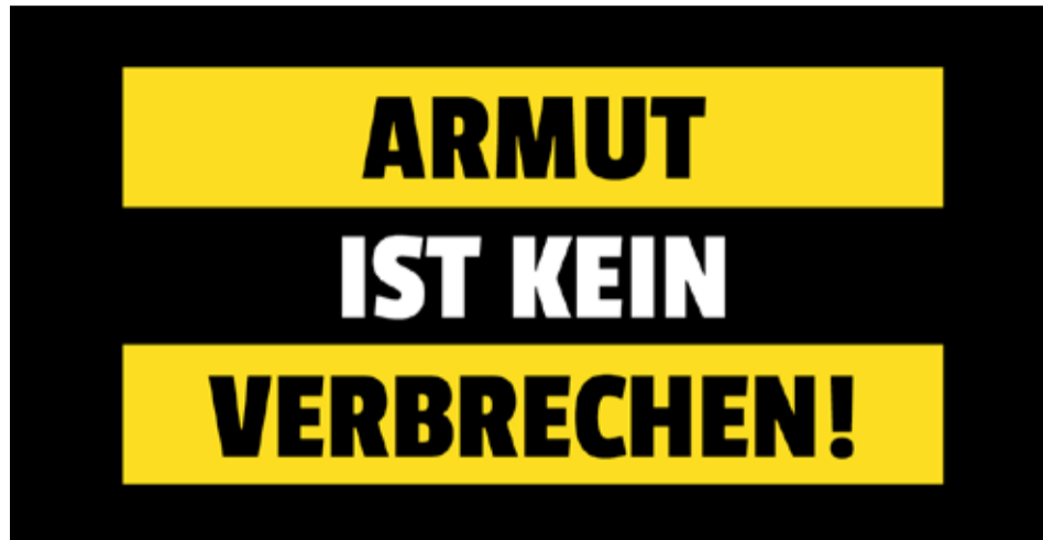
Siromastvo nije prekršaj

Parlamentarna inicijativa «Siromaštvo nije zločin» to želi da promjeni: migrantima koji već duže od deset godina žive u Švajcarskoj