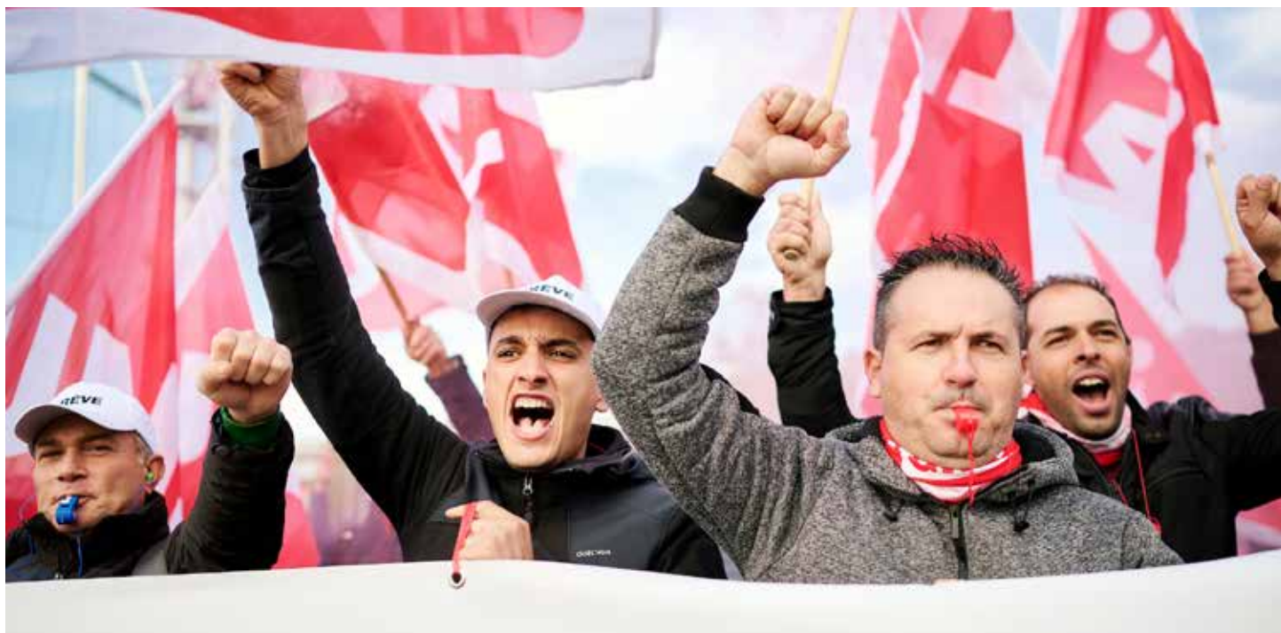
Radnici odlučni i žele pregovore u cilju poboljšanja radnog vremena i povećanje plata

Pritisak građevinskih radnika se isplatio: 28. novembra, u posljednjoj rundi pregovora, sindikati i Savez građevinskih poslodavaca su postigli dogovor. Uloženi napor se isplatio, jer konačno postignut sporazum. Dogovoreno je da broj godišnjih i sedmičnih radnih sati ostane isti, ali će doći do novog načina regulisanja radnog vremena. Novi LMV će važiti tri godine. Obračun sati će važiti od 1. maja tekuće godine do 30. aprila sledeće godine. Osnovana je i grupa koja će se baviti pitanjima zdravlja i sigurnosti na radnom mjestu. Borba za dobre uslove rada i solidarnost među radnicima se isplati.