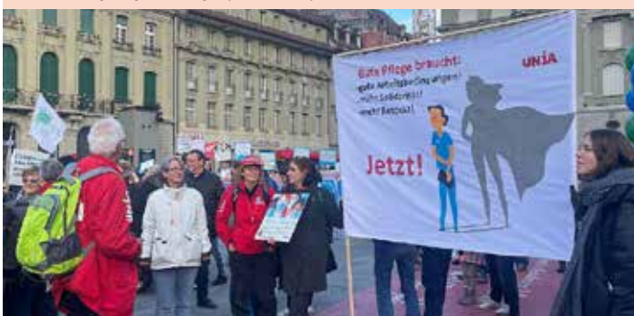
Plate (povećanje plata) 2022.

I godinu dana nakon usvajanja Inicijative za njegu, 300 njegovatelja svakog mjeseca napusti svoj posao. Kako bi se zaustavio egzodus osoblja, 26. novembra 2022. na trgu Bundesplatz u Bernu održana je velika akcija. Učesnici su tom prilikom tražili pet konkretnih mjera: plate/radno vrijeme: značajne povišice za isti obim posla, odnosno skraćivanje radnog vremena u slučaju zadržavanja iste plate; dodatke: ozbiljna povećanja postojećih dodataka i slobodnog vremena, kao i uvođenje dodataka za prekasne izmene planova rada; odmor: najmanje 5 nedelja do 49. godine, posle 50. godine 6 nedelja, posle 60. godine 7 nedelja; objektivno mjerenje radnog vremena i novčana nadoknada za to vrijeme: npr. uračunavanje vremena potrebnog za presvlačenje, put od jednog pacijenta do sljedećeg; čuvanje djece: dodaci za čuvanje djece koje pomaže porodici.