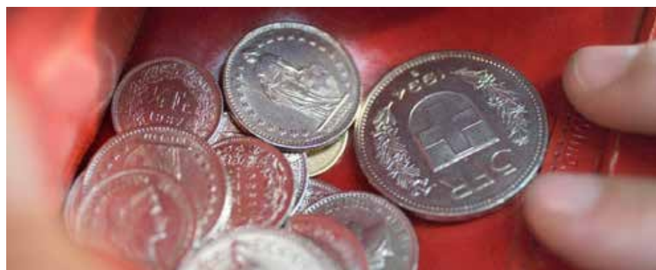
Moramo nastojati da povećanje plata generalno bude ujednačeno

mo da se trudimo da se plate izjednače s poskupljenjima,» kaže on. Bilo kako bilo, može se očekivati da će većina radnika u Švajcarskoj dobiti povećanje plata u 2023. godini.