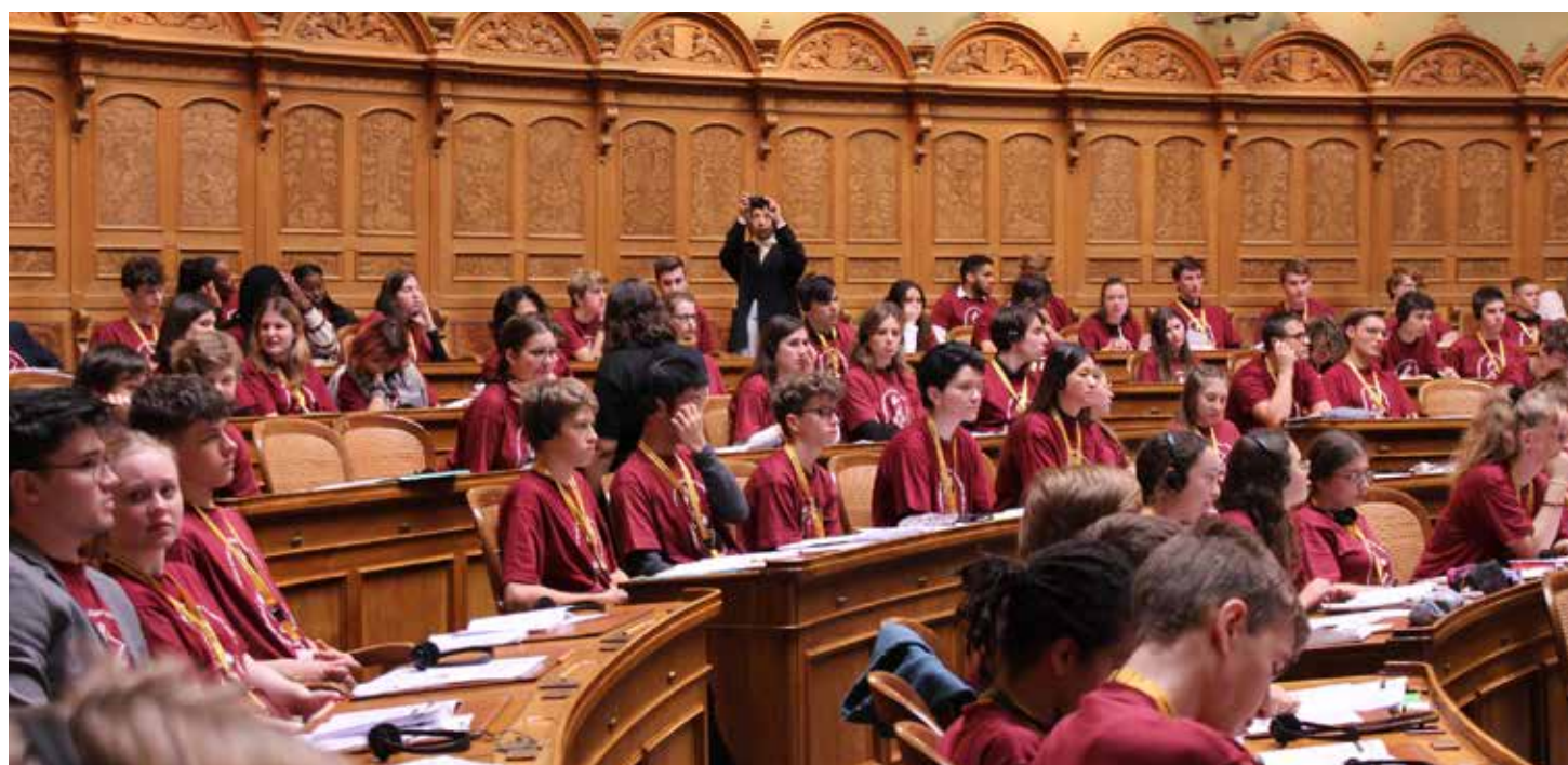
Mladi migranti žele da daju svoj doprinos u politici i spremni su da preuzmu obaveze

Svojim zahtjevima 200 mladih stavilo je do znanja da itekako imaju pojma o političkim aktuelnostima, da znaju kako da se informišu i kako da debatuju, i da žele da preuzmu odgovornost za naše društvo. U prosjeku sedamnaestogodišnji učesnici su time još jednom dokazali da imaju volje i sposobnosti da učestvuju u političkoj participaciji – od ulice, pa sve do parlamenta.