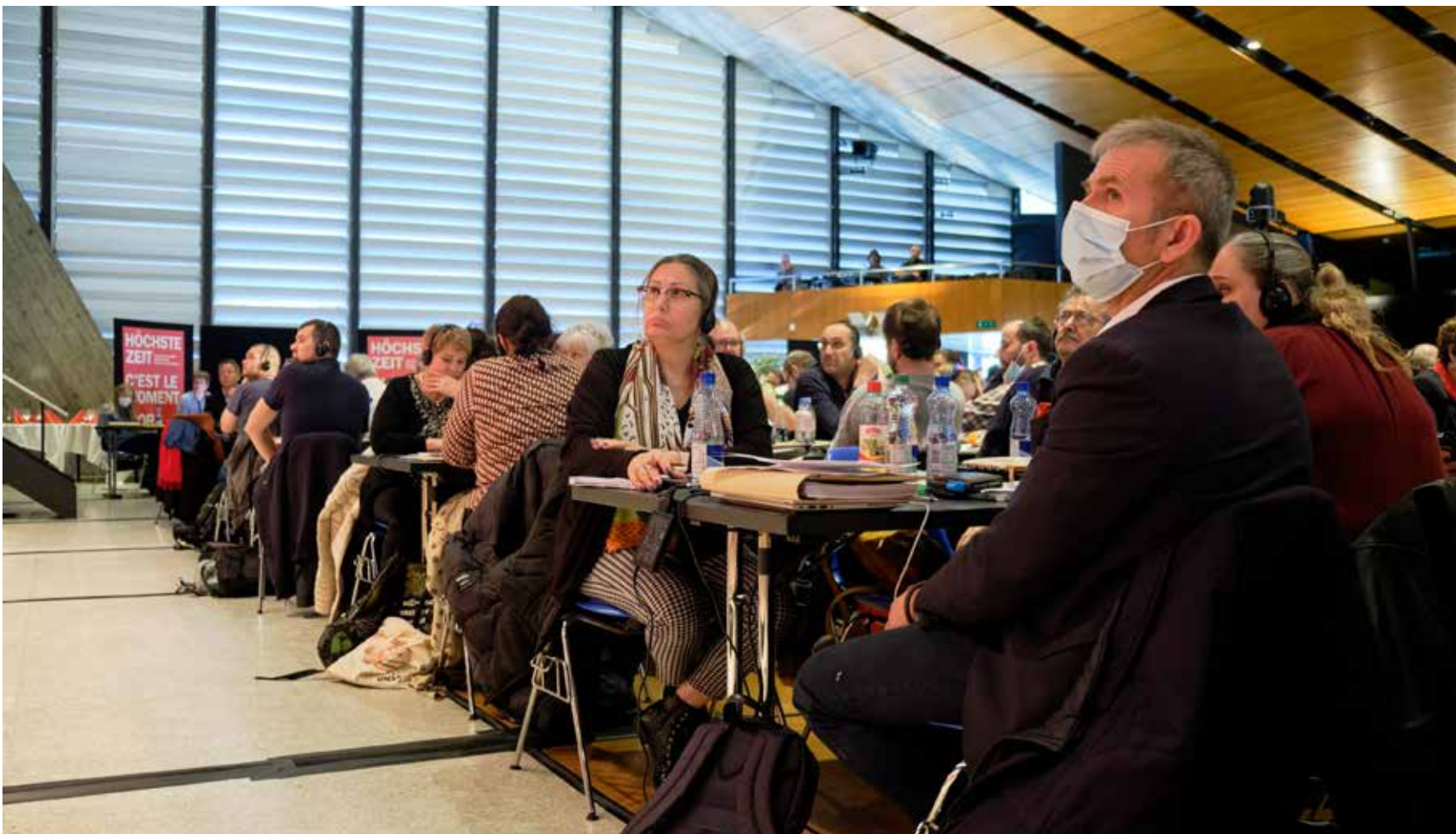
Pamje nga dita e tretë Kongresit të Unia dhe ndjekja e vëmendshme e punimeve nga Grupi i Interesit të Migracionit.

Dita e tretë e Kongresit të Unia tani së fundi, pas dy ditësh digjitale vitin e kaluar për shkak të koronës, u zhvillua përsëri në mënyrë analoge. Përqendrimi ishte tek një projekt-iniciativë e re.