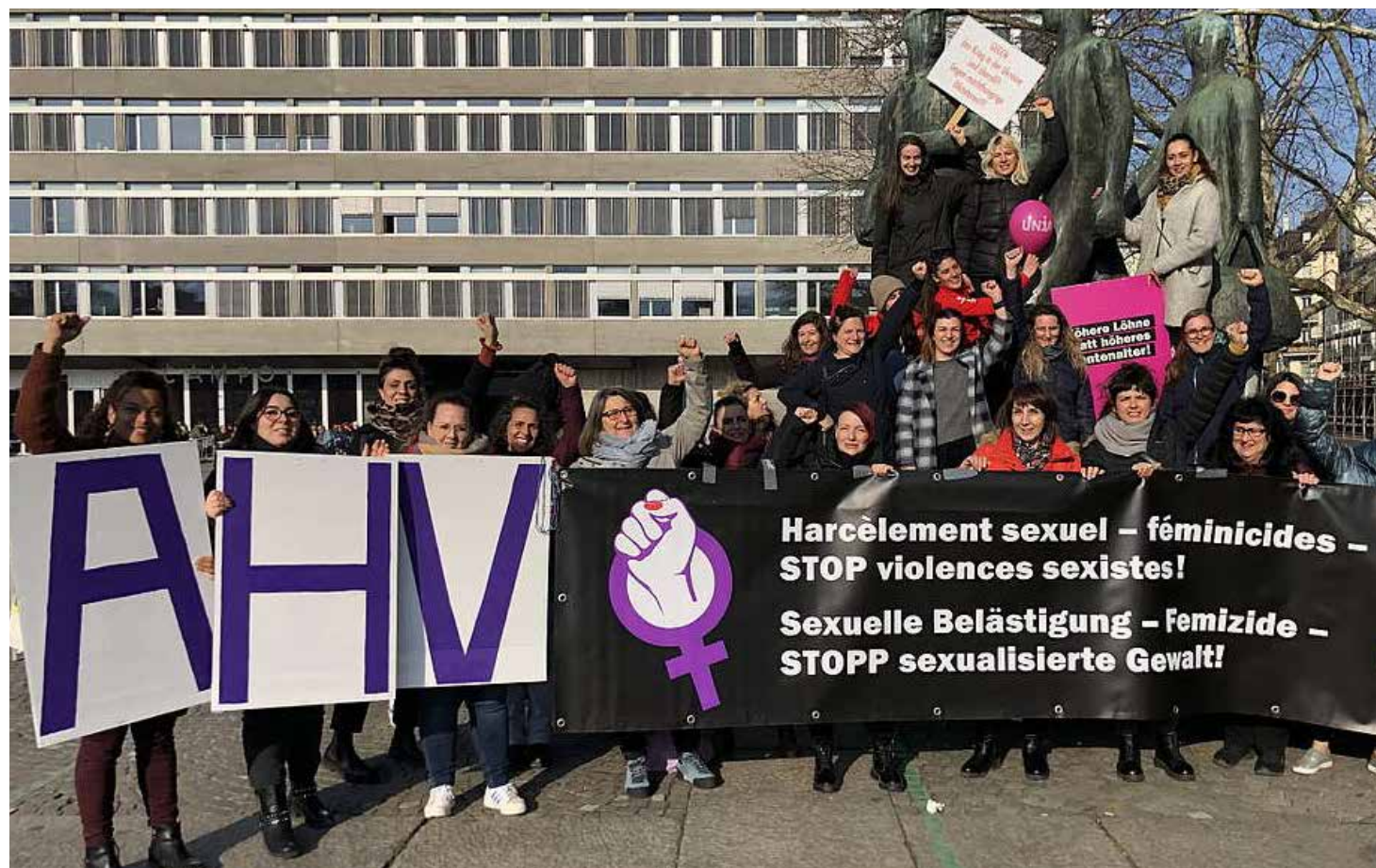
Pamje nga një aksion i sivjemë i grave ku kundërshtohet rritja e moshës së pensionit për gra, pabarazia, ngacmimi dhe dhuna seksuale

Në aksione kanë marrë pjesë migrante të shumta dhe i kanë adresuar zëshëm kërkesat e tyre: Njohja e diplomave të huaja, luftimi i diskriminimit të dyfishtë, Reduktim të pengesave përkitazi me natyralizim. Pranimi i temave specifike të grave si arsye për fitimin e azilit, barazi mundësisht dhe drejtësi në vendin e punës, e në shoqëri. Migrantet luftojnë plotësisht në kuptimin e Clara Cetkin: «Të luftohet, aty ku është jeta.»