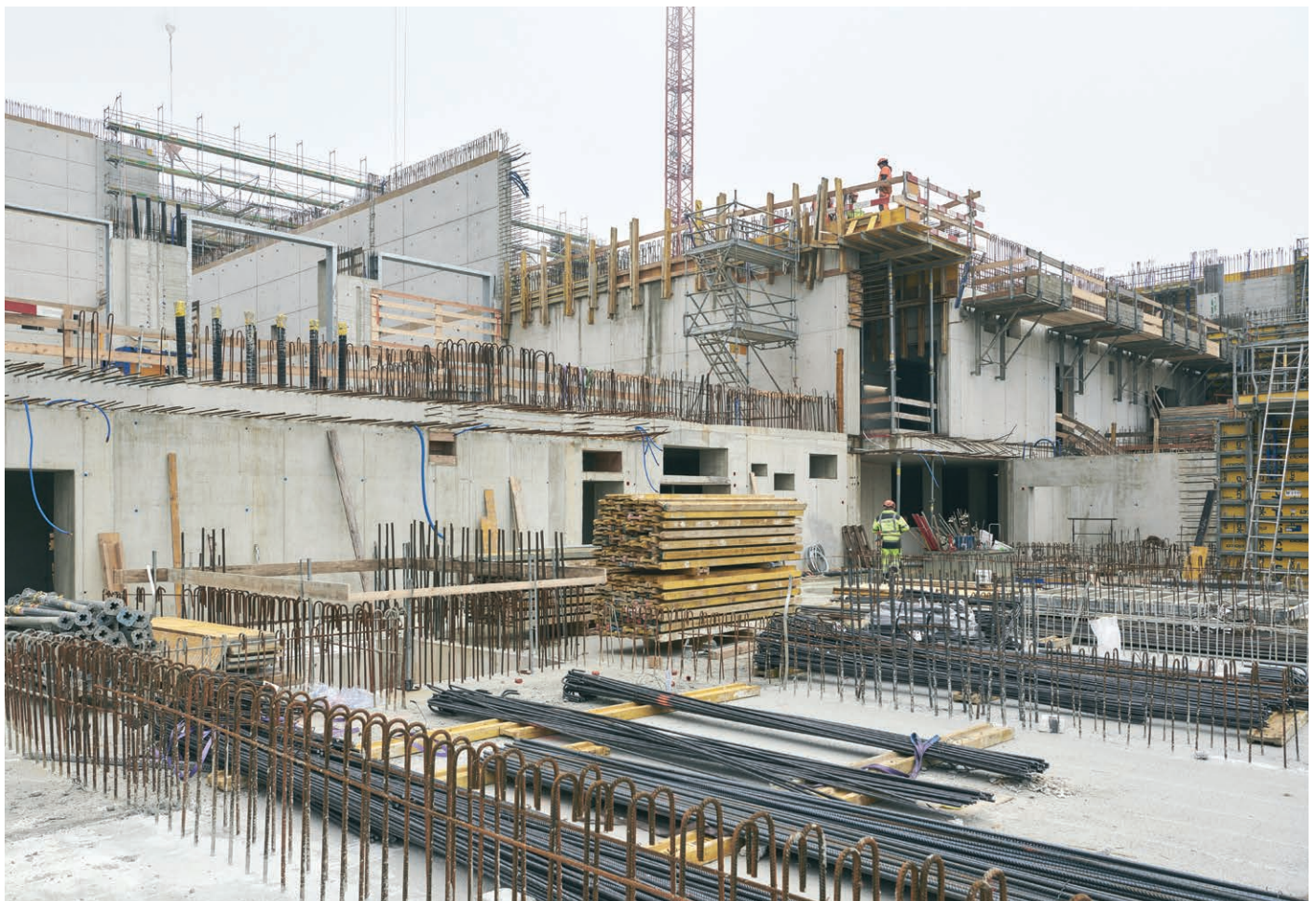
Pro Monat werden 2000 Kubikmeter Beton und 400 Tonnen Stahl verbaut.

fert und gelagert wird, beim sogenannten Bunker. Er wird bis zu 45 Meter hoch, einige Mauern sind bei unserem Besuch bis zur Hälfte hochgezogen. Der Bunker besteht aus fünf Abteilen mit einem Gesamtvolumen von 70000 Kubikmetern: ein Anlieferungskompartiment, in welches die LKWs und Bahnwagen den Müll hineinschütten