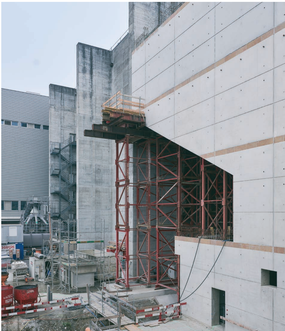
Wie beim Brückenbau: Für die Erstellung der rund 12 Meter ausragenden Bauteile werden massive Lehrgerüste eingesetzt.

Aushub hat den Verantwortlichen viel Kopfzerbrechen, eine mehrmonatige Verzögerung und Mehrkosten von mehreren Millionen Franken verursacht.