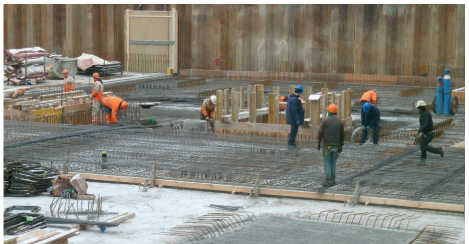
Erhöhte Unfallgefahr: Arbeiten bei schlechten Wetterbedingungen kann gefährlich sein.

Der Arbeitgeber hat zudem die Möglichkeit, bei einer Arbeitsunterbrechung von mindestens einem halben Tag Schlechtwettergeld bei der Arbeitslosenversicherung (ALV) zu beantragen.