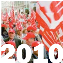
1. Januar 2010: Die Gebäudetechnik Tessin schliesst sich der Stiftung RESOR an.

so der Beiträge und die Überprüfung und Ausrichtung der Rentenleistungen einer gemeinsam zu errichtenden und zu verwaltenden Institution in der Form einer Stiftung übertragen werden. Um den gesetzlichen Anforderungen aus dem Bereich der beruflichen Vorsorge zu genügen, mussten die im GAV enthaltenen Regelungen über Beiträge und Leistungen in einem Reglement der Stiftung gespiegelt werden. Erst damit erhielt die Stiftung einerseits die Möglichkeit, selbstständig Beiträge einzufordern, andererseits wurde sie damit den Berechtigten gegenüber direkt verpflichtet.