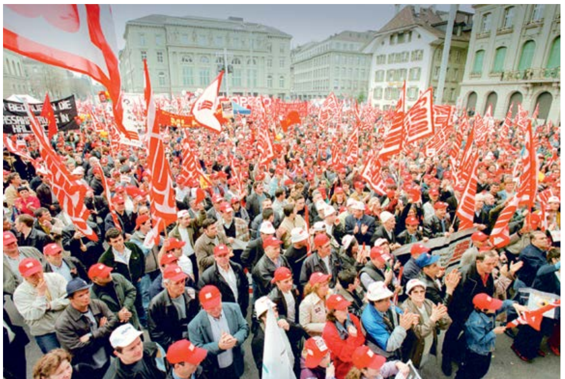
Nationale Baudemo auf dem Bundesplatz in Bern, 16. März 2002.