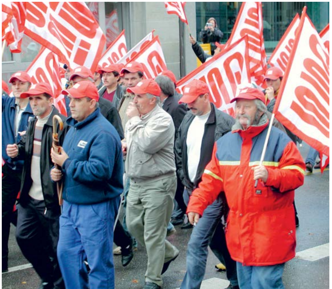
Nationaler Streiktag in Zürich, 4. November 2002.

1. Juli 2003: Inkraftsetzung des GAV FAR mit der sukzessiven Einführung des Rentenalters 60 im Bauhauptgewerbe.