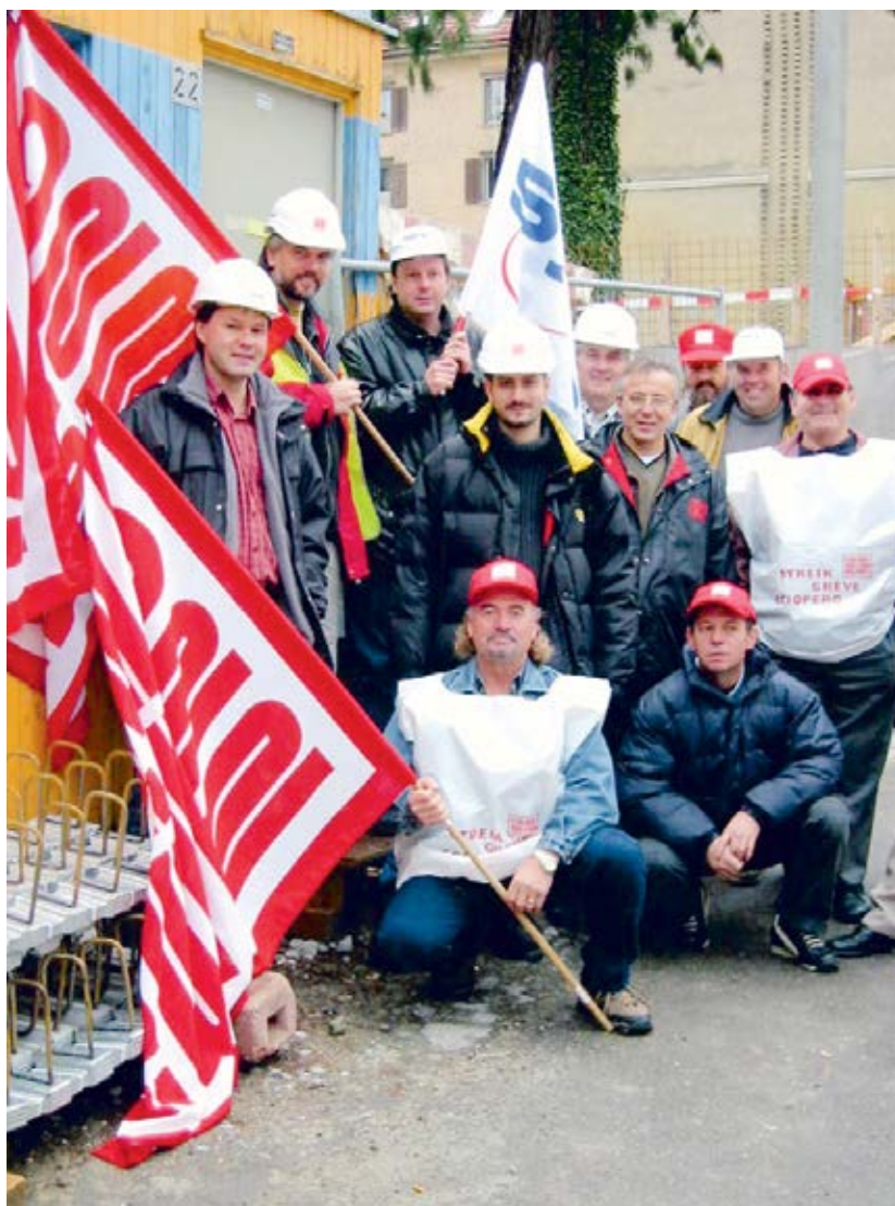
Streikende auf der Casino-Baustelle in St. Gallen, 5. Oktober 2002.