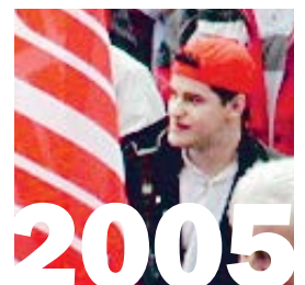
1. Januar 2005: Das Maler-, Gipser- und Plattenlegergewerbe von Basel-Stadt und das Fliesenlegergewerbe von Baselland schliessen sich der Stiftung RESOR an.

Trotz dieser Verurteilung kommen Bauarbeiter seit über zehn Jahren in den Genuss des mit dem FAR erkämpften sozialen Fortschritts.