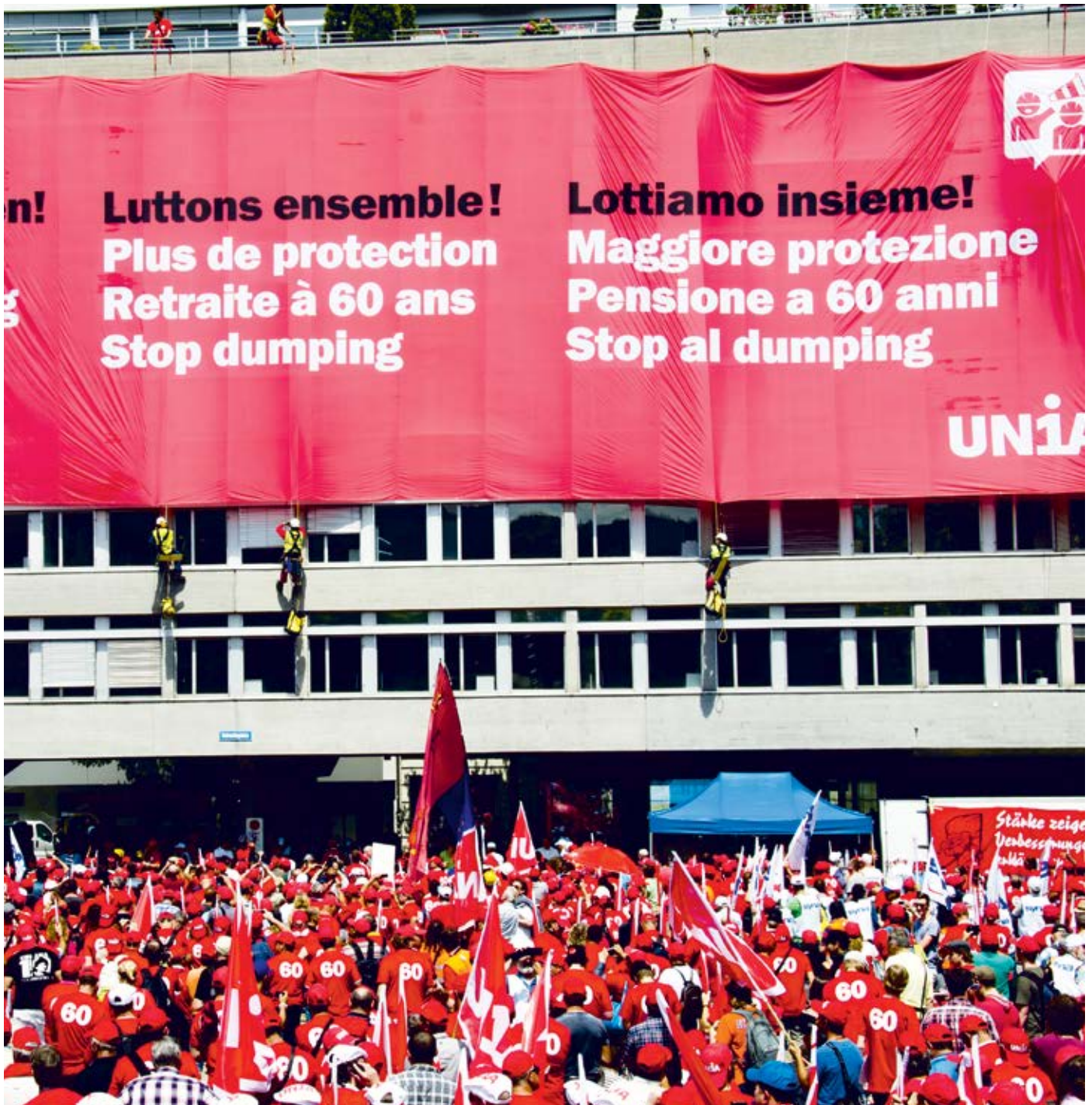
Nationale Baudemo in Zürich, 27. Juni 2015.

Dreizehn Jahre nach dem erfolgreichen Kampf für die Rente mit sechzig stehen die Bauarbeiter also wieder am Ausgangspunkt. Sie werden ihre Errungenschaft verteidigen. Wie gesagt: wenn nötig auch mit Streik.