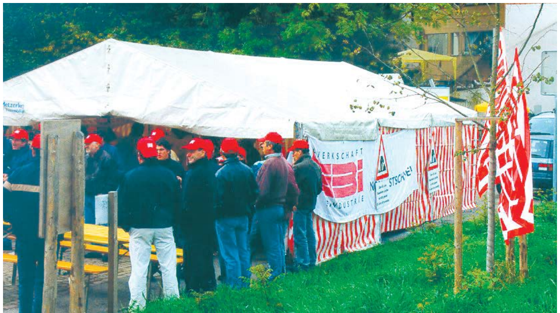
Protestaktion auf einer Baustelle der Firma Frey in Kaiseraugst, 10. Oktober 2002.