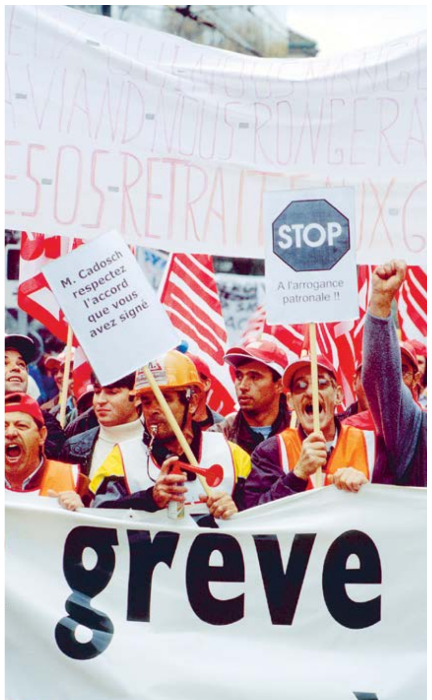
Nationaler Streiktag in Lausanne, 4. November 2002.

Bauarbeiter damals vorgezeigt, dass Einheit und Entschiedenheit der Arbeitnehmenden beim Verfolgen eines klaren und legitimen Ziels immer noch Siege möglich machen. Mit dem Rentenalter 60 wurde auf einen Schlag die Lebensarbeitszeit der Bauarbeiter um zehn Prozent reduziert! Ein exemplarischer Kampf und ein exemplarisches Resultat – beispielhaft auch für andere Bewegungen und für die Verteidigung aller sozialen Errungenschaften.