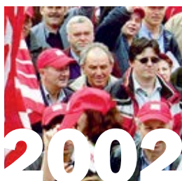
26. Januar 2002: Nach gescheiterten Verhandlungen beschliessen die GBI-Baudelegierten die Einleitung von Streikmassnahmen im Bauhauptgewerbe ab April 2002 und unterstreichen ihren Willen mit einer Demonstration in Basel.

der Verwaltung klar vereinbart. Die Baumeister hatten den Auftrag, das Inkasso zu übernehmen. Darauf waren sie gut vorbereitet, weil sie das für den Parifonds sowieso schon machten, und sie erhielten dafür auch Geld. Weiter hatten wir beschlossen, dass die Auszahlung der Renten über die Gewerkschaft abgewickelt würde. Da gab es also keinen Verhandlungsbedarf mehr. Vielleicht wäre es schwieriger geworden, wenn wir das nicht alles schon im Vertrag geklärt gehabt hätten.