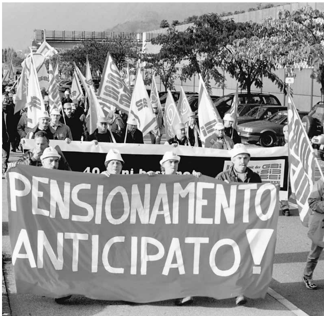
Umzug der Streikenden in Bellinzona, 4. November 2002.

Nach achtstündigem Verhandlungsmarathon kommt es im Bauhauptgewerbe zur ersten Einigung auf die Eckwerte eines Frühpensionsmodells mit dem Rentenalter 60.