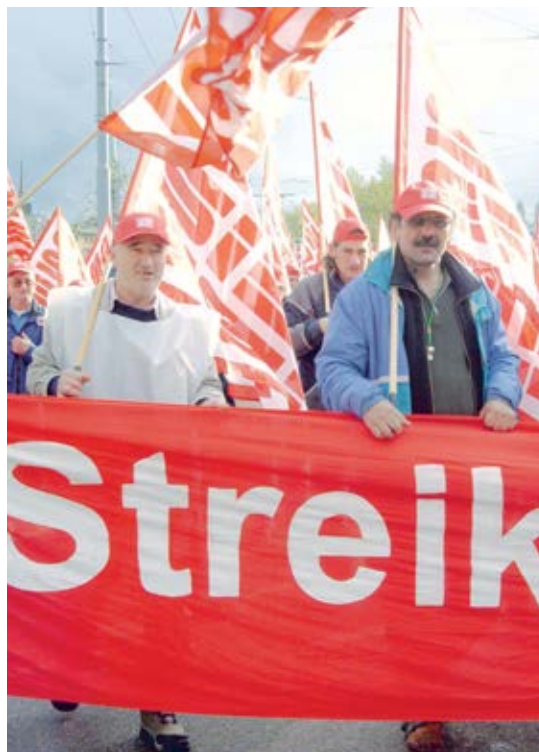
Umzug der Streikenden in Zürich, 4. November 2002.

Eine zweite, verbindlichere Absichtserklärung für ein Frührentenmodell wird im LMV 1995/97 verankert. Zu einer Lösung während der Vertragsdauer kommt es auch diesmal nicht.