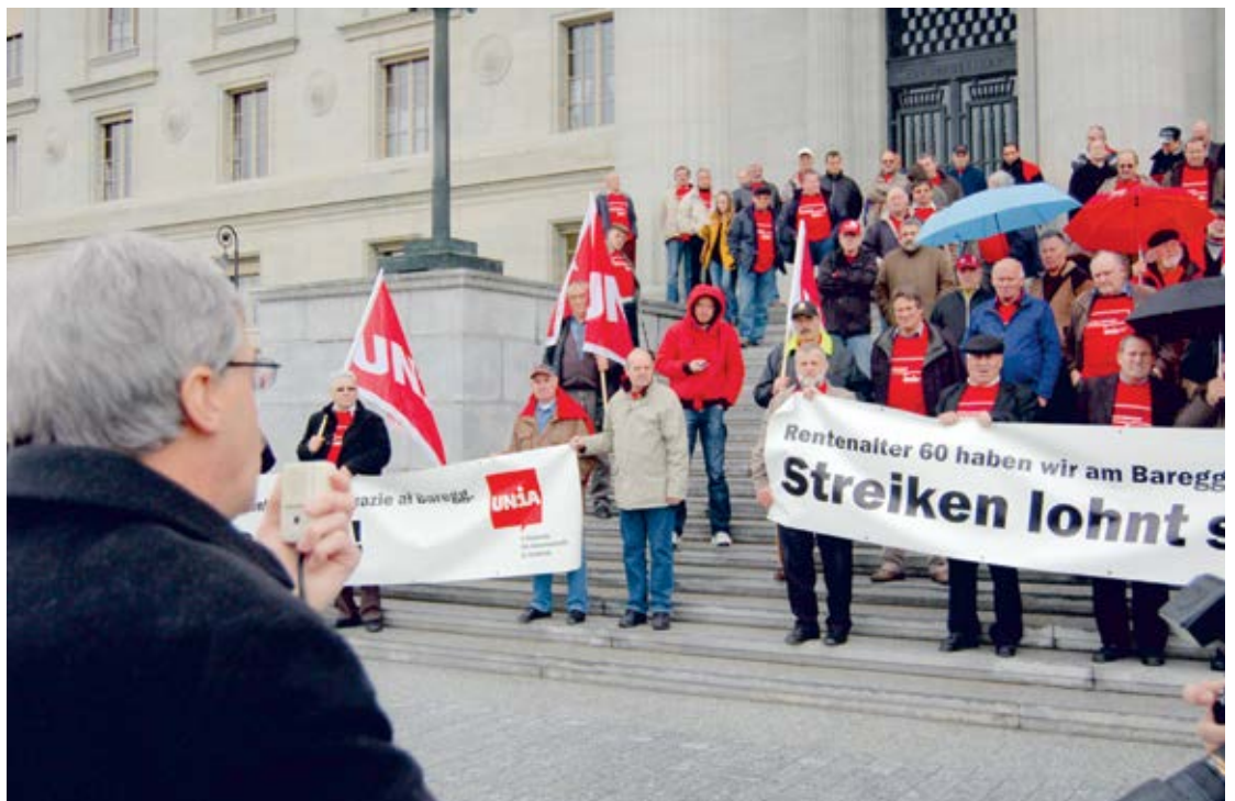
Die Verurteilung durch das Bundesgericht im April 2008 widerspricht internationalen Standards sowie der Auffassung der Internationalen Arbeitsorganisation (ILO).