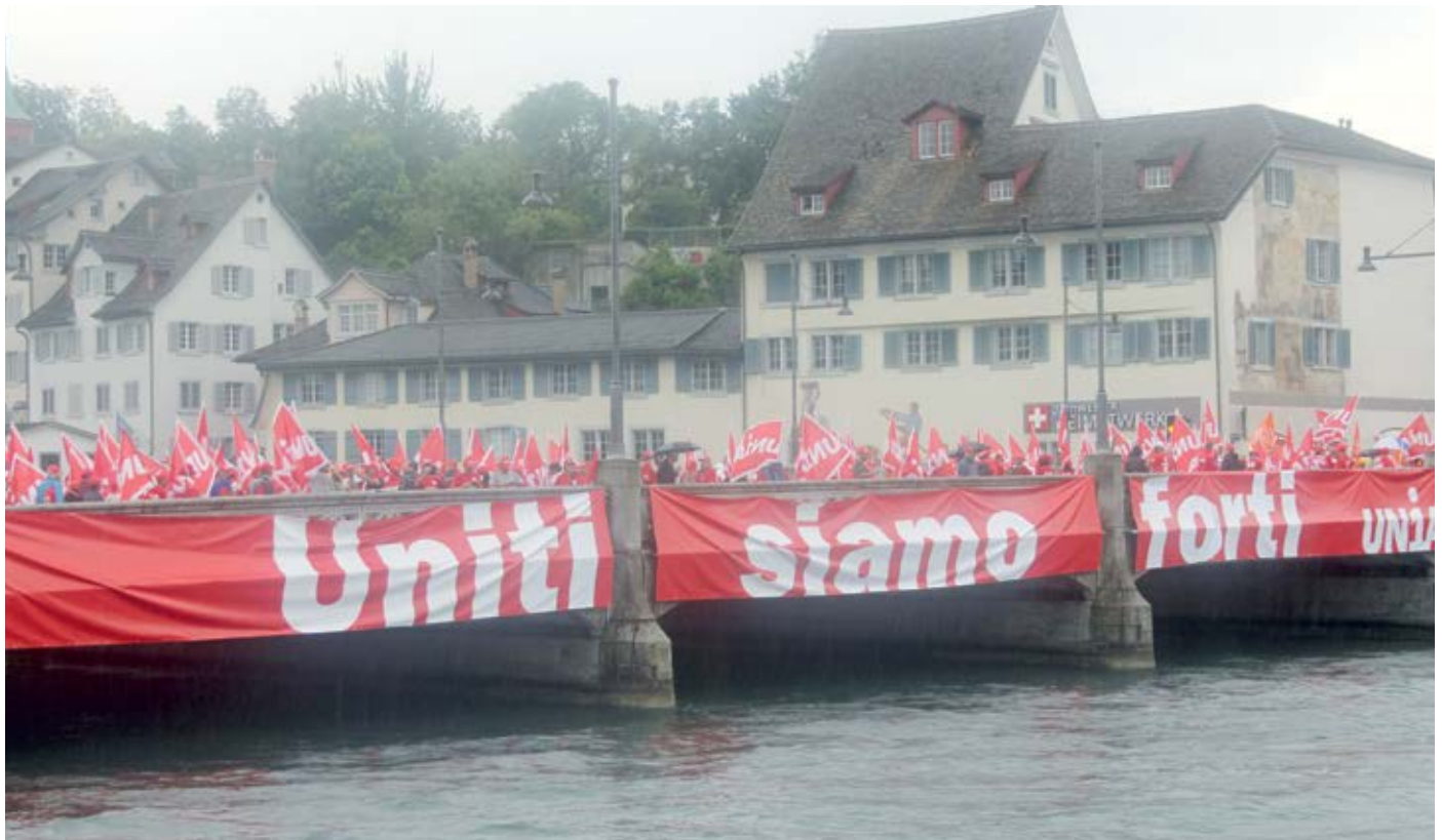
15 000 Bauarbeiter demonstrieren in Zürich für die Erhaltung des FAR 60 und für einen besseren Landesmantelvertrag, 27. Juni 2015.

Nachdem mit den Maler- und Gipsermeistern mehr als zehn Jahre lang über die Einführung eines Frühpensionierungsmodells gestritten wurde, scheint heute die Bereitschaft so gross wie noch nie, bei der bevorstehenden Vertragserneuerung eine Lösung analog dem Modell VRM zu finden.