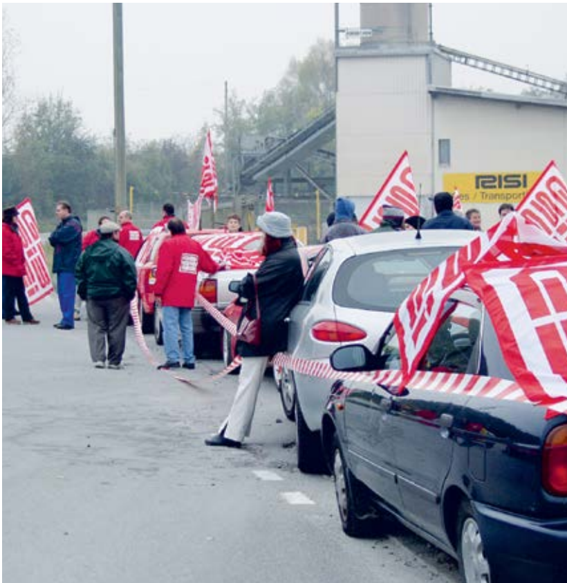
Hardliner Risi liefert keinen Kies mehr aus. Blockadeaktion in Cham, 10. Oktober 2002.