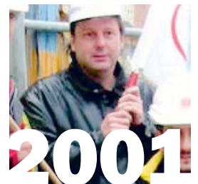
Oktober 2001: Regionale Mobilisierungen. Aktionen für mehr Mittel bei der Flexibilisierung des Rentenalters im Rahmen der 11. AHV-Revision. Gewerkschaftliche Besuche bei Ständerräten zu Hause.