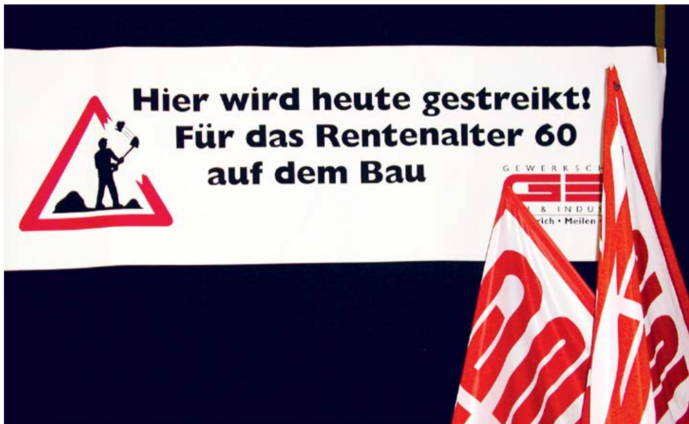
Transparent am nationalen Streiktag in Zürich, 4. November 2002.

dass die GBI früher oder später die Lohnfrage in den Mittelpunkt stellte. Es war ein grosses Verdienst der Bewegungsführung, dass es ihr gelang, die Delegierten der Berufskonferenz Bau der GBI vom 11. Oktober und vor allem vom 15. Dezember 2001 praktisch einhellig auf das Rentenalter 60 als zentrales Verhandlungsziel einzuschwören. Die übrigen Forderungen, insbesondere das Ausmass der Lohnerhöhung, waren von diesem Moment an vor allem taktische Elemente im Verhandlungsprozess.