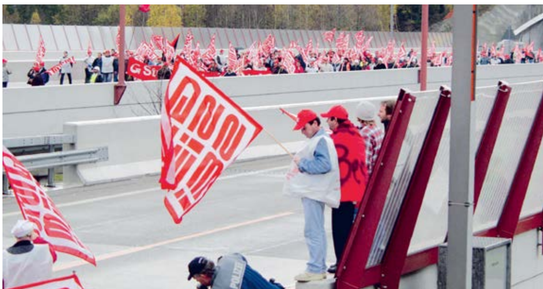
Streikende vor dem blockierten Baregg Tunnel, 4. November 2002.

16. März 2002: Grosse nationale Demonstration der Bauarbeiter in Bern, 12 000 TeilnehmerInnen, Konsultativabstimmung zum Streik auf dem Bundesplatz.