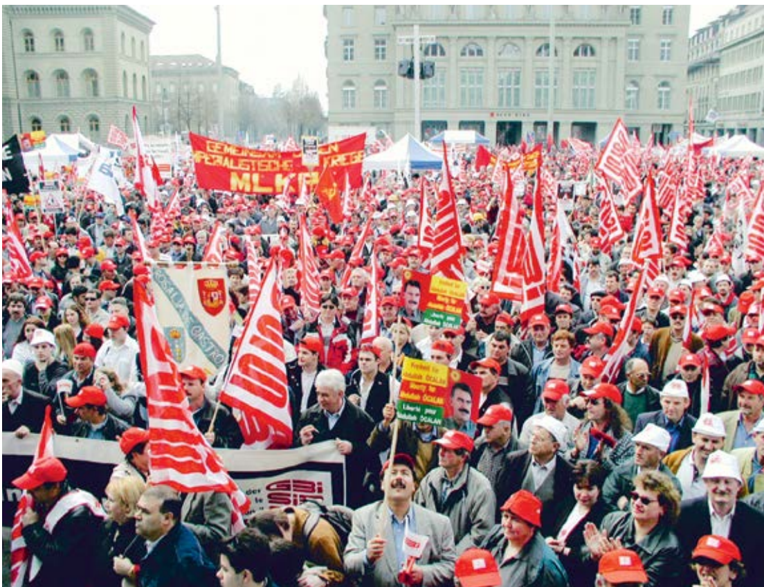
Nationale Baudemo in Bern, 16. März 2002.

21. September 2002: Die GBI-Berufskonferenz Bau beschliesst, dass die Friedenspflicht im Bauhauptgewerbe bis zum rechtsgültigen Abschluss des GAV FAR suspendiert wird und die Streikkasse freigegeben ist. Gleich nach der Berufskonferenz versammeln sich über 500 Delegierte spontan zu einer unbewilligten Demonstration und einer Verkehrsblockade im Zentrum von Bern.