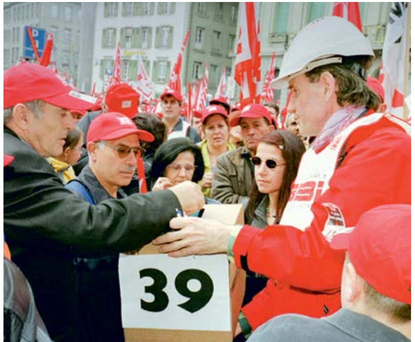
Urabstimmung an der nationalen Demo in Bern, 16. März 2002.

Burger: Ein Stück weit war es vielleicht die Verwegenheit der Jugend, ich war damals 24 Jahre alt! Im Nachhinein wird mir fast etwas unwohl dabei ... Wie gesagt, wichtig war die Erfahrung bei der Zentralwäscherei Basel zwei Jahre früher. Dort schien die Situation am Anfang total aussichtslos, der VPOD hatte schon aufgegeben, und wir führten die Kampagne – es ging um eine Lohnsenkung – mehr als ein Jahr lang. Damals hatte ich den glei-