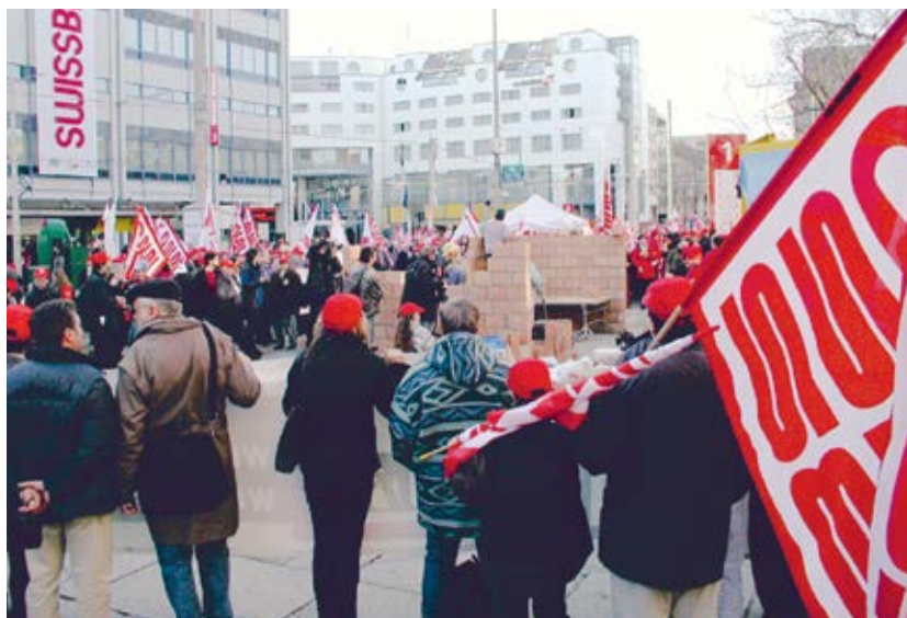
Protest vor der Swissbau in Basel, 18. Januar 2002.

«Es ging nichts kaputt, und es passierte zum Glück auch kein Unfall. Diese Aktion war nötig. Dank ihr haben wir bekommen, was wir wollten.»