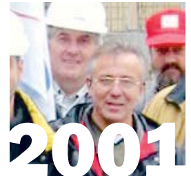
16. Dezember 2001: Die Berufskonferenzen Bau von GBI und Syna lehnen ein letztes Angebot der Baumeister für den neuen LMV ab. Die GBI trifft konkrete Vorbereitungen für den vertragslosen Zustand ab April 2002.

Scheidegger: Der erste Schock für uns war, als bekannt wurde, wen die Baumeister in den Stiftungsrat schickten. Sie haben die Hardliner entsandt, jene, die alles daran gesetzt hatten, den Abschluss zu verhindern. Am Anfang dachten wir, dass das nicht gut herauskommen würde. Gleichzeitig hatten wir aber vertraglich alles konkret und genau abgemacht, sodass relativ wenig Spielraum bestand und wir nur noch umsetzen und nichts mehr verhandeln mussten. Das war ein zentraler Punkt. Wir hatten auch die Aufgabenteilung bei