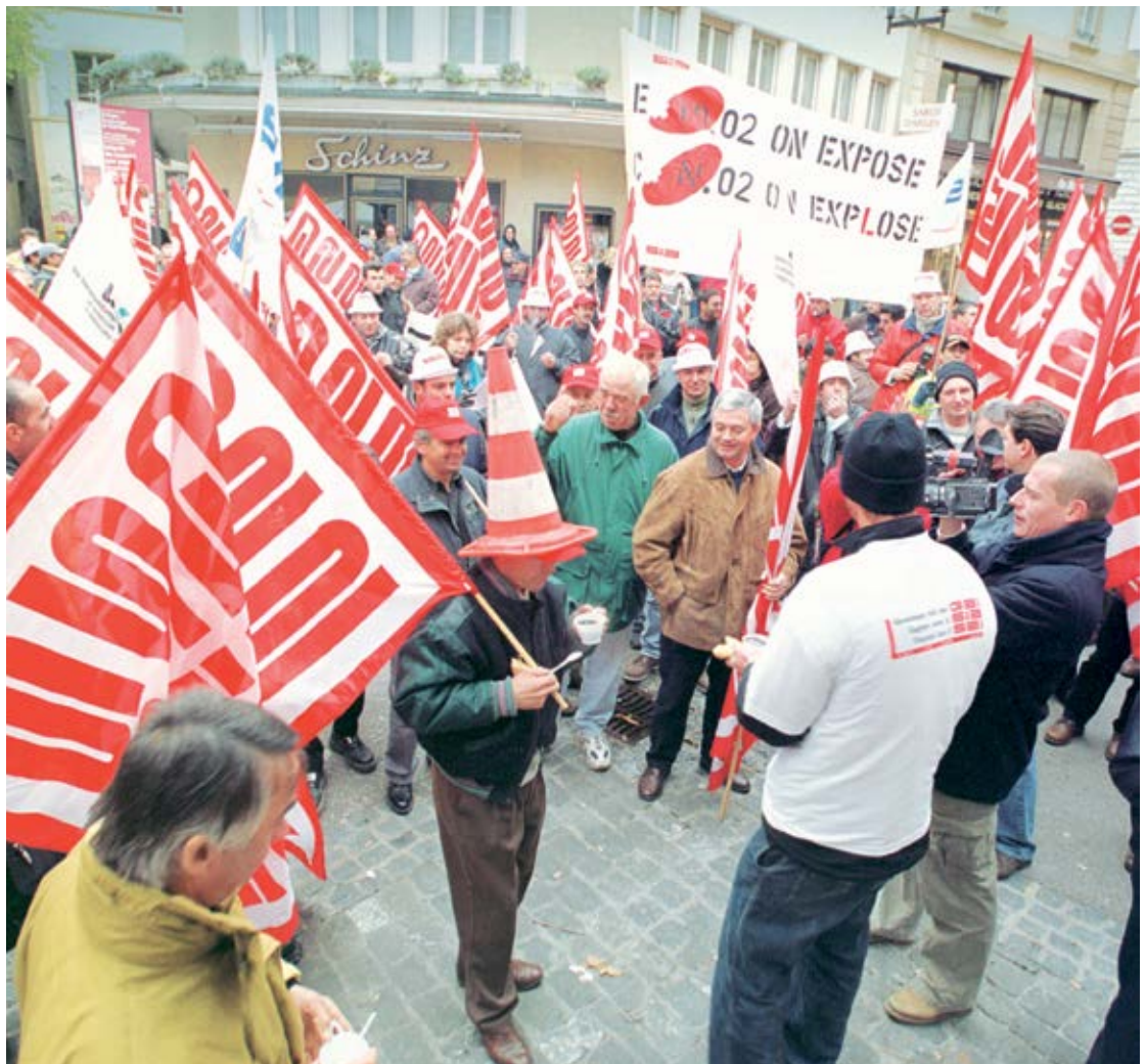
Protestdemonstration für das Rentenalter 60 in Neuchâtel, 19. November 2001.

(Das Gespräch fand am 22. Januar 2015 in Aarau statt.)