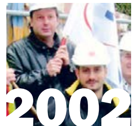
27. Juni 2002: Kehrtwende beim SBV. Die Delegierten der Baumeister lehnen an ihrer DV den ausge- handelten GAV mit Ren- tenalter 60 offiziell ab.

«Wir wussten ja damals nicht genau, wie viel Kampfkraft wir tatsächlich hatten, also mussten wir eine grosse Stärke zumindest demonstrieren. Die Symbolik war gut. Medial wurde die Baregg-Blockade ein unglaublicher Erfolg.»