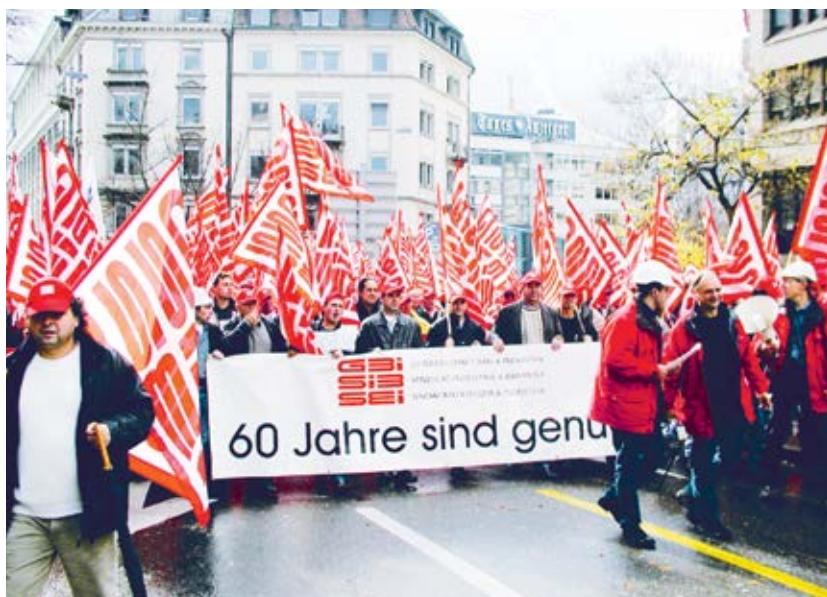
Demonstration in Zürich, nationaler Streiktag vom 4. November 2002.

bis dato ganz klar auf unserer Seite war, hätte jetzt kippen können. Als ich spät am Abend erschöpft ins Büro zurückkam und meinen PC startete, waren schon mehr als siebzig Protest-E-Mails von aufgebrauchten Automobilisten eingetroffen, die mit Strafanzeigen drohten oder diese ankündigten.