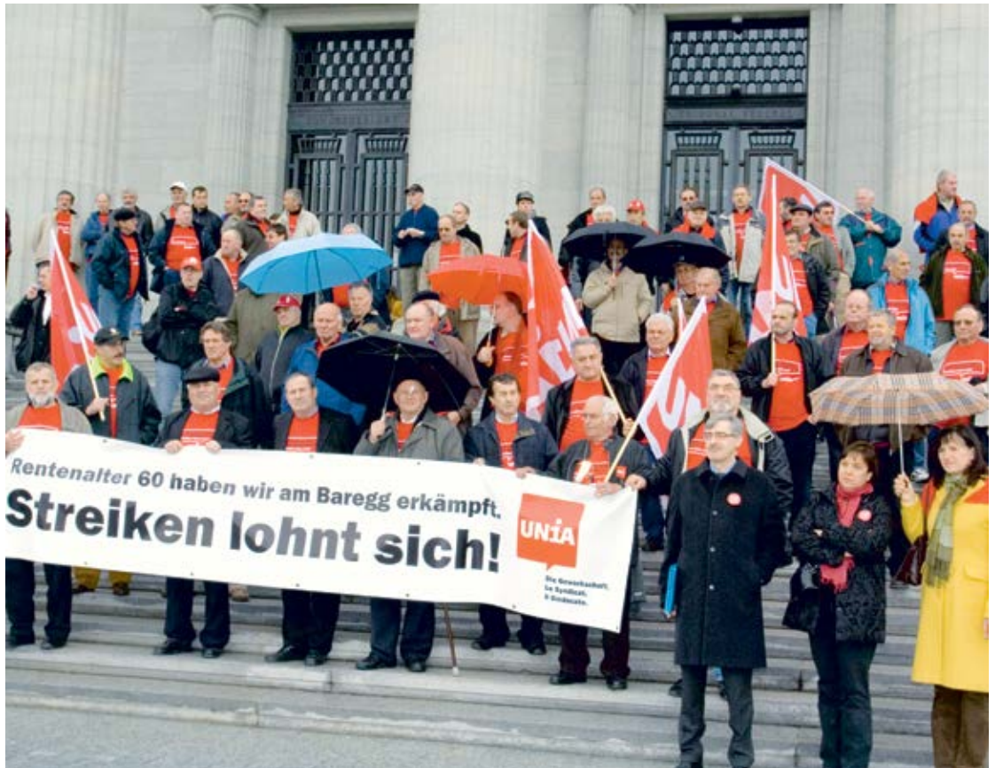
Der Baregg-Prozess vor Bundesgericht. Protestaktion mit Angeklagten, Vertrauensleuten und Frühpensionierten, 3. April 2008.

1. Juli 2004: Im Ausbaugewerbe der Westschweiz tritt der GAV zum Frühpensionierungsmodell RESOR in Kraft. Die daraus entstandene Stiftung RESOR bietet eine Frühpension mit 62 Jahren.