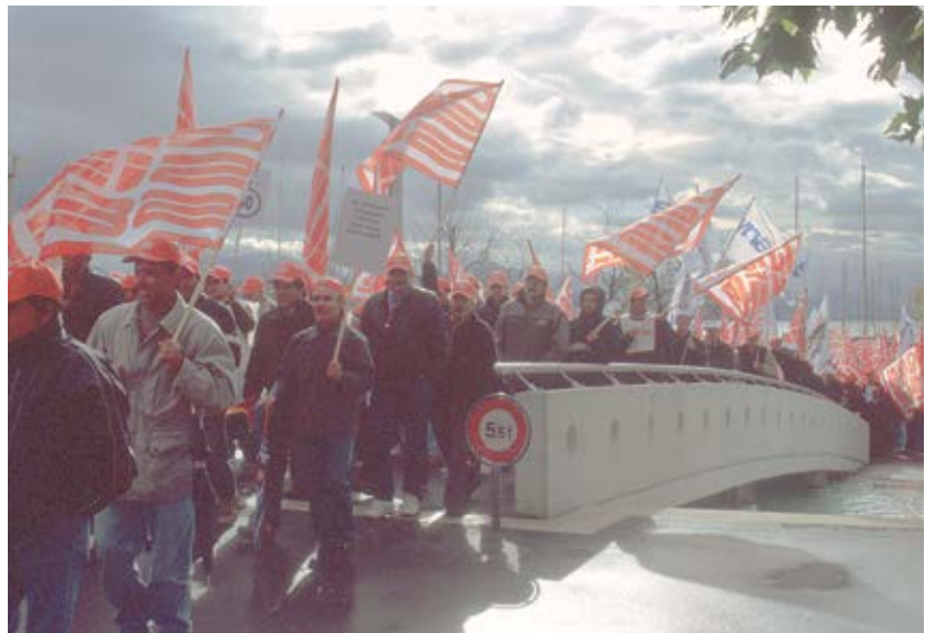
Kundgebung in Lausanne, 4. November 2002.

D'Incau: Ja, sie sind durch den Tunnel gegangen. Wir, das heisst, fünf bis sechs Personen waren gerade dabei, auf der anderen Seite grosse Transparente aufzuhängen. Da kamen auch von der Berner Seite her Cars mit Leuten. Sie fuhren langsam und hielten an. Die Leute stiegen aus und liefen in den Tunnel hinein. Ich muss sagen, das werde ich in hundert Jahren nicht vergessen. Im Zelt war man ahnungslos. Oder hast du gewusst, dass man die Autobahn sperren wollte?