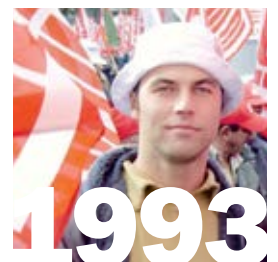
1993: Die DV des SBV (Schweizerischer Bau- meisterverband) lehnt ein bescheidenes Modell für Teilpensionierungen ab, es wäre durch ein Prozent Lohnabzug finanziert worden.

Im März und April 2001 führte die GBI im Hinblick auf die anstehenden LMV-Verhandlungen auf den Baustellen der gesamten Schweiz eine breit angelegte Umfrage durch, um herauszufinden, welches die wichtigsten Forderungen und Wünsche der ArbeitnehmerInnen waren. An der Umfrage beteiligten sich über 4000 Beschäftigte. Hinsichtlich der Prioritätensetzung brachte die Untersuchung ein klares Resultat: Fast 60 Prozent bezeichneten die frühzeitige Pensionierung als dringendste Forderung auf dem Bau, 28 Prozent plädierten vor allem für mehr Lohn, und nur je knapp 7 Prozent gaben mehr Ferien und der Abschaffung der Gleitstundenregelung den Vorrang. Der von den Delegierten der nationalen Berufskonferenz des Baugewerbes Mitte Mai 2001 beschlossene Forderungskatalog enthielt neben dem Rentenalter 60 allerdings noch ein ganzes Bündel weiterer Massnahmen. Die Konzentration eines solchen Katalogs auf die wesentlichen Forderungen ist für die Bewegungsführung in jedem Verhandlungsprozess eine grosse Herausforderung. Es gilt dabei zu vermeiden, dass sich unterschiedliche Gewichtungen zu einer Spaltung ausweiten oder verfestigen. In den Rezessionsjahren seit 1992 führte die Bewegungs- und Verhandlungsdynamik meist dazu,