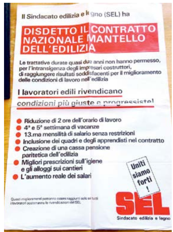
Plakat von 1990 für die Erneuerung des Landesmantelvertrags. Erstmals taucht die Forderung nach einer Frühpensionierung auf («cassa pensione»).

Nach zehn Jahren Kampf standen wir mit leeren Händen da; dies verursachte Frust und wurde zum Glaubwürdigkeitsproblem für die Gewerkschaft Bau und Industrie (GBI). Vor der Erneuerung des LMV 2002–2005 war es für die Bewegungsleitung deshalb klar, dass sich ein dritter Anlauf nur lohnte, wenn es am Ende des Verhandlungsprozesses gelingen könnte, eine fixfertige Lösung rasch in Kraft zu setzen. Die Zeit der Absichtserklärungen war vorbei. Um das Ziel endlich zu erreichen, musste die Frühpensionierung zur ersten Hauptforderung werden, sogar noch vor einer Lohnerhöhung. Und eine weitere Erkenntnis machte sich in der Gewerkschaft breit: Ohne offenen Kampf war ein früheres Pensionsalter nicht zu erhalten. Diese Einschätzung hat sich später als richtig erwiesen. Der Wechsel an der Spitze des Sektors Bau mit der Wahl von Hansueli Scheidegger im Jahr 1999 und der vorangegangene mehr