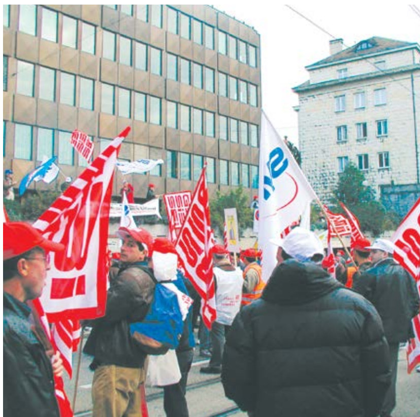
Protest vor dem Sitz des Baumeisterversbands in Zürich, 27. September 2002.