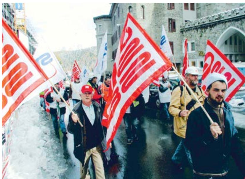
Umzug der Streikenden in St. Moritz, 18. Oktober 2002.