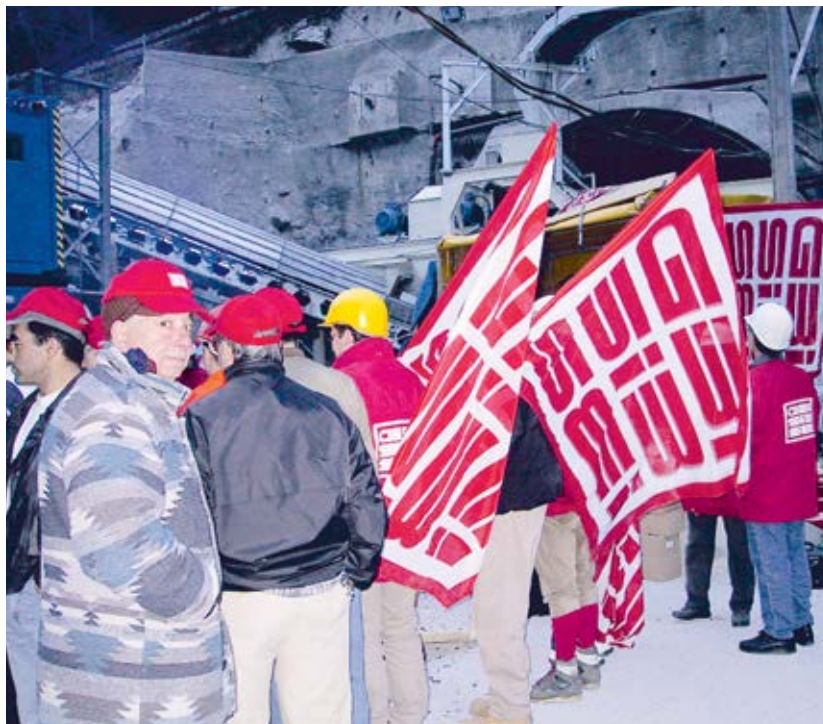
Streikaktion auf einer Baustelle im Raum Neuchâtel, 19. November 2001.

Angesichts der Tatsache, dass das Kürzel FAR bei den Arbeitgebern im Ausbaugewerbe zu einem absoluten Tabuwort geworden war und uns die nötige Mobilisierungskraft in den Ausbaubranchen fehlte, entschieden wir uns für eine andere Strategie: die regionale Ausweitung des Modells RESOR. FAR war Geschichte, RESOR jedoch war ein Fundament, auf das wir aufbauen konnten. In den folgenden