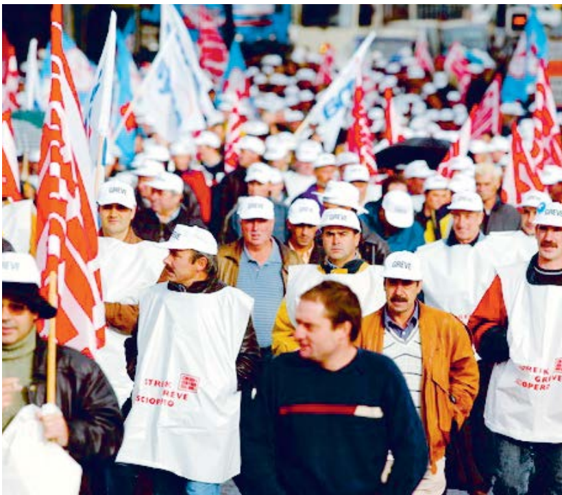
3600 Streikende allein in Genf, 4. November 2002.

Wyder: Es wäre auch wichtig, jetzt als Nächstes die Krankenkassen in Ordnung zu bringen und günstiger zu machen. Wir sollten Reklame für die Wahlen im Herbst machen, sodass nur jene gewählt werden, die sich um die Krankenkassen kümmern. Damit könnte man der SVP den Wind aus den Segeln nehmen, und die Leute hätten mehr Geld in der Tasche.