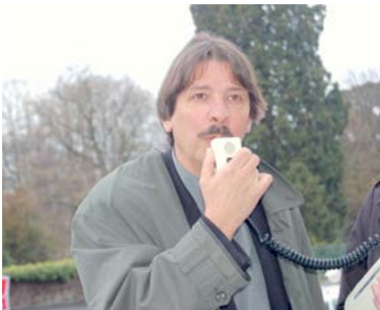
«Ausserordentliche Situationen erfordern besondere Antworten»: Paul Rechsteiner vor dem Bundesgerichtsgebäude, 3. April 2008.

3. April 2008: Das Bundesgericht in Lausanne weist die Beschwerde der vier wegen der Aktion am Baregg verurteilten GBI-GewerkschafterInnen ab.