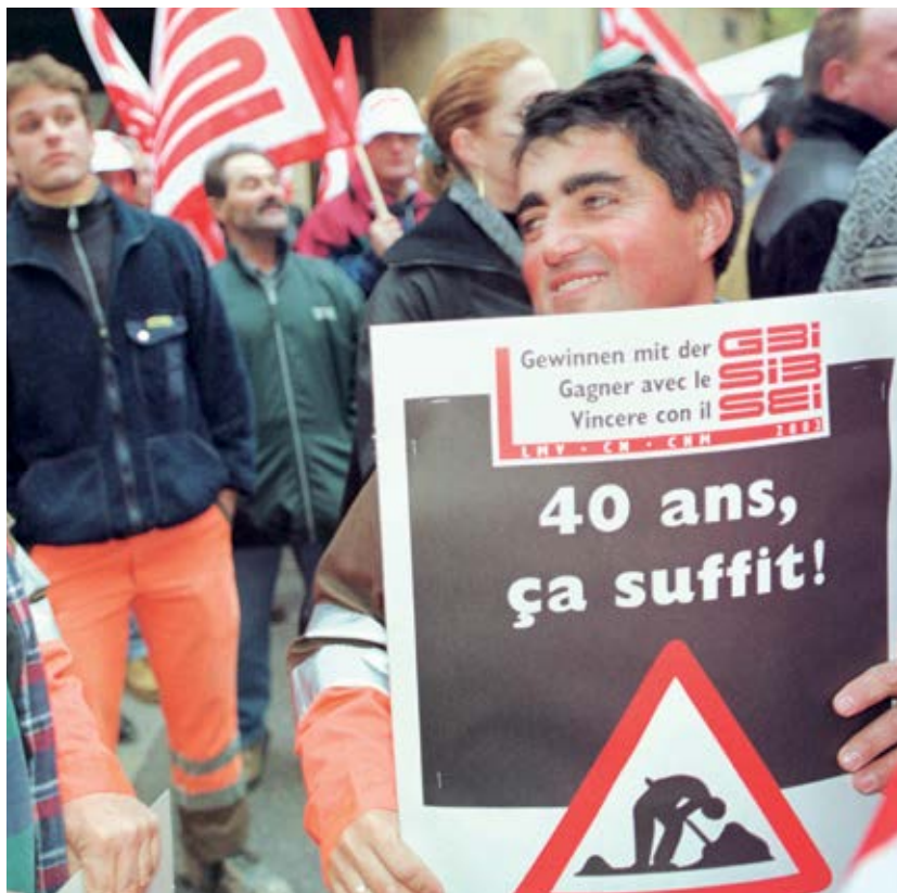
40 Arbeitsjahre genügen: Protestaktion in Neuchâtel, 19. November 2001.

Nach zehnjähriger Aufbauarbeit waren in den drei Verwaltungsstellen der Stiftung gesamthaft mehr als 35 Personen tätig. Jährlich werden heute mehr als 1300 Rentengesuche beurteilt und monatlich über 5000 Renten ausbezahlt. Dafür werden über 330 Millionen Franken Beiträge bei über 4200 Betrieben mit rund 80 000 Mitarbeitern eingezogen. Das Anlagevolumen beträgt heute knapp 900 Millionen Franken.