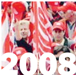
1. August 2008: Einführung eines Frühpensionierungsmodells (analog zu RESOR) in der Marmor- und Granitbranche.