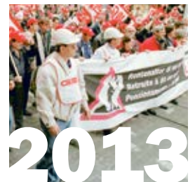
1. Januar 2013: Das Maler- und Plattenlegergewerbe von Baselland schliesst sich der Stiftung RESOR an.

Dank der Streikbewegung während des Jahres 2002 mit ihrem Schlusspunkt am Bareggturn-