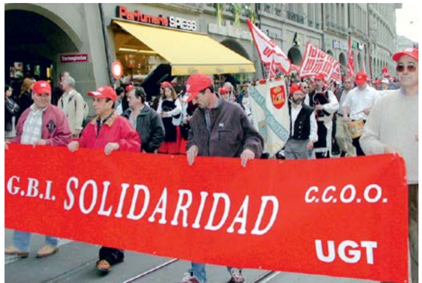
Nationale Baudemo, Umzug durch Bern, 16. März 2002.

Scheidegger: In diesem Kontext hatten wir aber verhandelt, und dies kommt in deinem Text nicht vor. Im Dezember 2001 lag mit Rentenalter 62 und einer mickrigen Lohnhöhung eine Lösung auf dem Tisch, die von der Verhandlungsdelegation unter Druck der Syna und auch der gemässigten Kräfte in den eigenen Reihen eventuell akzeptiert worden wäre, wenn wir nur beim Lohn noch etwas mehr bekommen hätten. Wir haben den sich abzeichnenden Kompromiss dann scheitern lassen. Innerhalb der Bewegung, auch innerhalb der Lei-