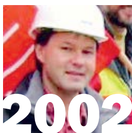
Sommer 2002: Die Gewerkschaften schliessen Nachverhandlungen strikt aus, da sie die Vereinbarung vom März 2002 für die Vertragsparteien als verbindlich ansehen.

Burger: Auf unserer Seite des Bareggs vielleicht zehn.