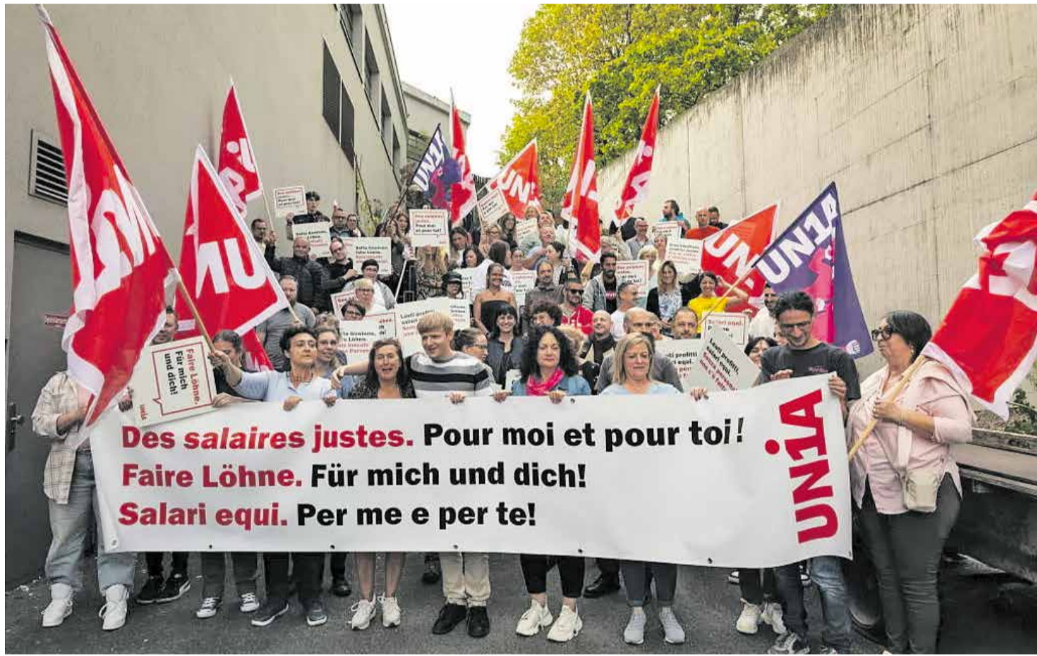
Pamje nga demonstrata e 16 nëntorit 2023 në Bernë për paga të drejta dhe fuqinë blerëse

Megjithatë, humbjet reale të pagave prej 2,7% mesatarisht të akumuluar në 2021 dhe 2022 nuk mund të kompensohen nga përmbyllja e negociatave ekzistues të pagave. Ne kemi fituar disa beteja, por jo ende luftën: bllokada e pagave në ndërtimtarit është një sfidë e madhe. Prandaj, për t'u dhënë më në fund punëtorëve pjesën që u takon, mobilizimet edhe shumë më të forta janë të nevojshme vitin e ardhshëm.