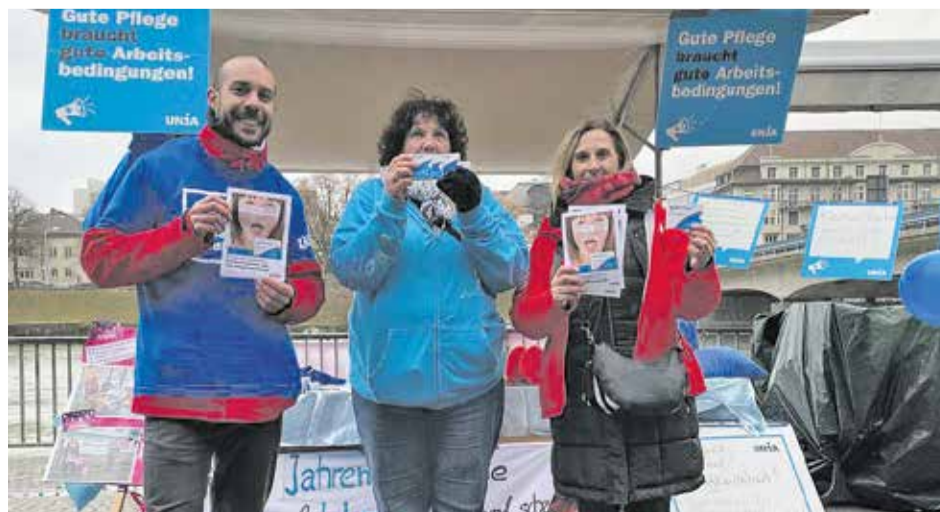
Infermierët në aksion: Kujdesi i mirë ka nevojë për kushte të mira pune!

Ligji nuk i mbron mjaftueshëm punonjësit e kujdesit, infermierisë dhe mbështetjes. Për shembull, ata kanë periudha më të shkurtra të pushimit se sa pjesa tjetër e fuqisë punëtore dhe mund të planifikohen më shpesh për punë në fundjavë. Kushtet e punës, veçanërisht për punonjësit në shtëpitë e kujdesit dhe të pleqve, rrallë rregullohen nga Kontratat Kolektive të Punës (KKP). Kushtet e këqija të punës kanë ndikim edhe në shëndetin e infermiereve, gjë që është një nga arsytet pse pothuajse gjysma e tyre largohen nga profesioni.