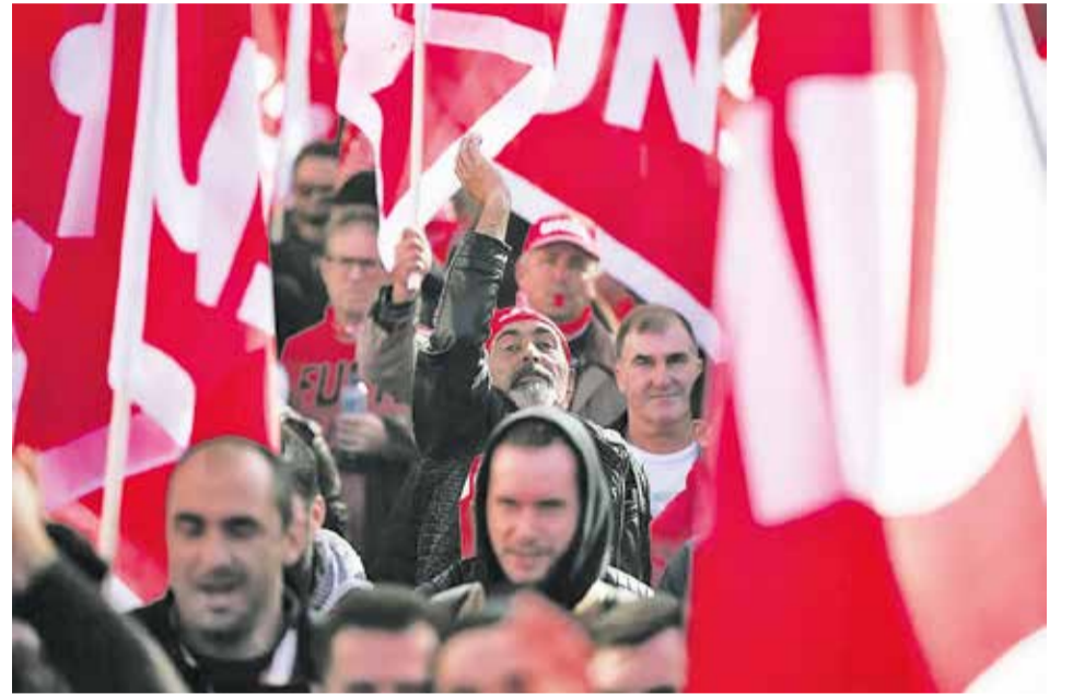
Pamje nga njëra nga demonstratat e punëtorëve të ndërtimtarisë

Shoqata e sipërmarrësve të ndërtimit u rekomandon «urgjentisht» anëtarëve të saj të mos nënshkruajnë kontrata për punë dhe shërbime me ndërtuesit pa kompensim automatik të inflacionit. Dhe kjo me të drejtë. Është edhe më e pakuptueshme që po e njëjta shoqatë kundërshton çdo rritje të përgjithshme të pagave. Fakti që gjërat mund të bëhen ndryshe tregohet nga sektorët e industrisë së ndërtimit, ku një rritje e përgjithshme e pagave këtë vjeshtë u negociua pothuajse kudo – në disa raste ndjeshëm mbi inflacionin.