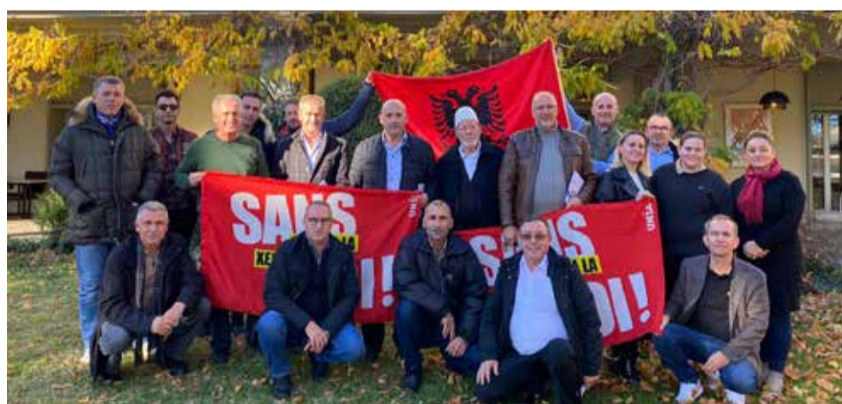
Seminari i zhvilluar në prag të Festave e Nëntorit dha shkas për t'i uruar të gjithë bashkëkombasët!

Të 20 pjesëmarrës:et e këtij seminarit, nga të cilët edhe të tillë që ishin për herë të parë në një seminar të tillë, ishin tejet aktiv në bashkëbisedim dhe dhanë edhe ide konkrete se si së bashku mund të kontribuojmë për