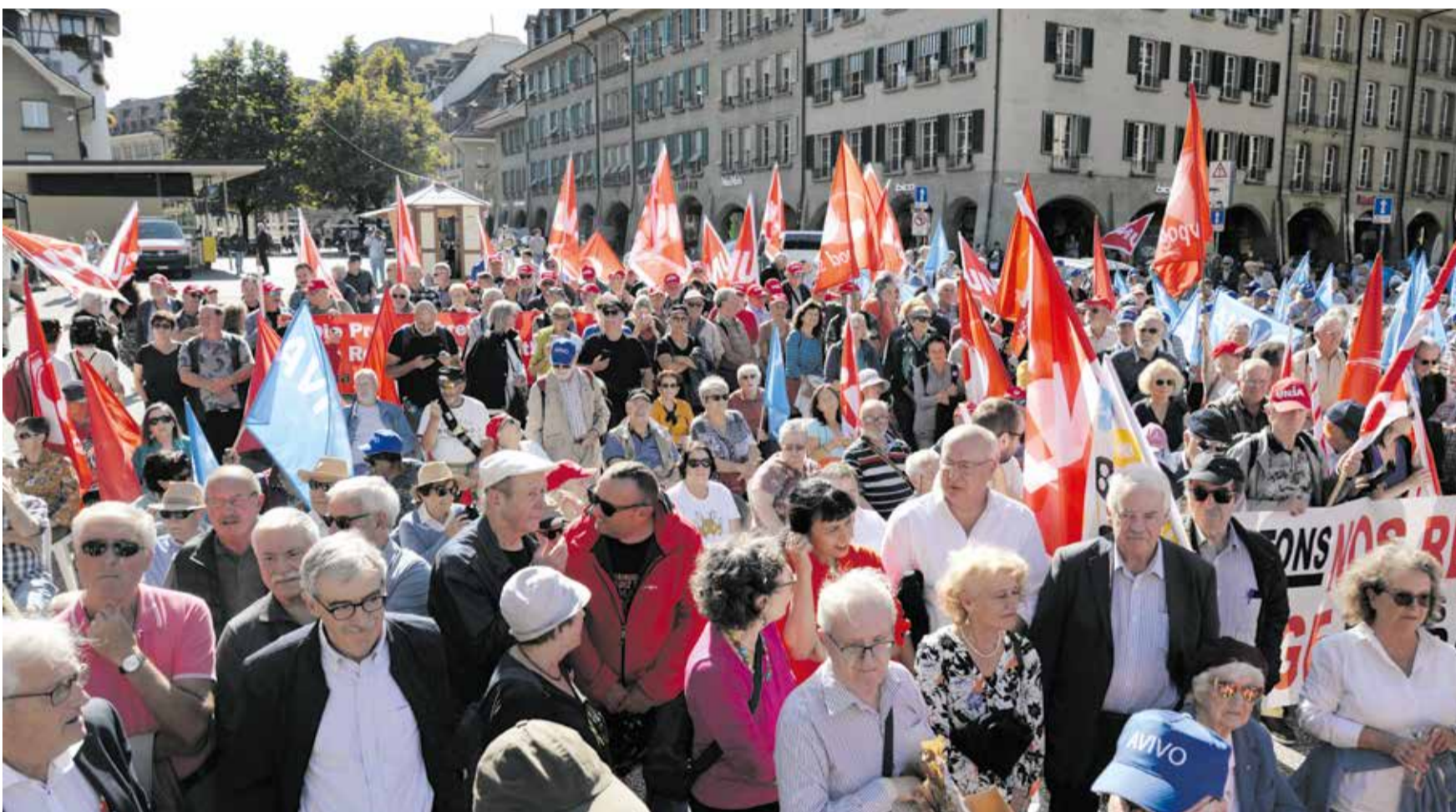
Pamje nga manifestimi për pensionin e 13-të të AHV/AVS i organizuar nga pensionistët e Unia dhe partnerëve e 25 shtatorit 2023 në Bernë

Në mars 2024, ne do të votojmë dy propozime. Së pari, nismën tonë AHV/AVS x 13, e cila synon rritjen e pensioneve, e për të cilën ne duhet të angazhohemi dhe të ndihmojmë që kjo nismë të triumfojë. Së dyti, të refuzojmë nismën tjetër të pensioneve, e cila dëshiron të rrisë moshën e pensionit në 67 vjeç. Qëllimi është që, në vitin 2024, të parandalohet përkeqësimi i mëtejshëm i pensioneve dhe forcimi i AHV/AVS-së.