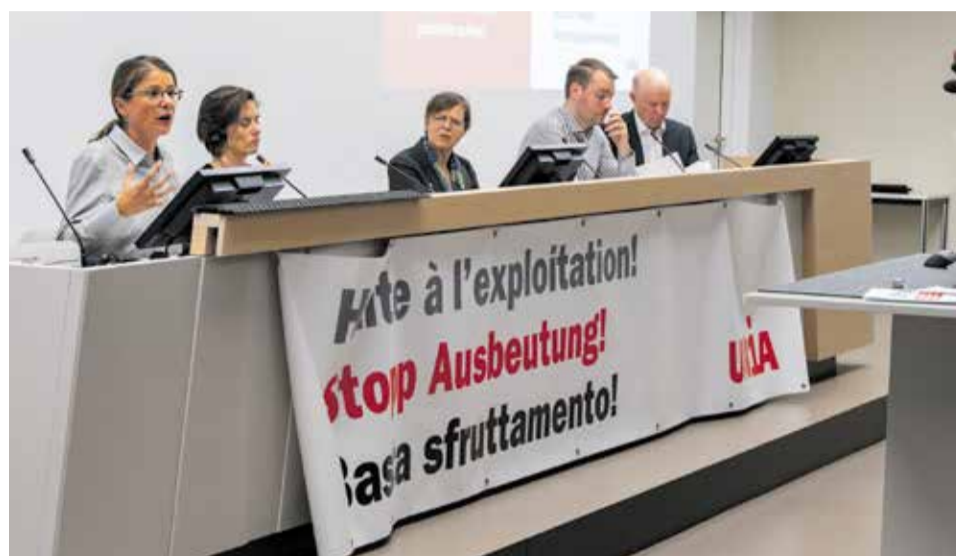
Zaustavimo zloupotrebu i trgovinu ljudima

Ono što na prvi pogled možda djeluje potpuno nemoguće, nažalost je stvarnost: trgovina ljudima postoji i u Švajcarskoj, a broj prijavljenih slučajeva sve više raste. Unija je odlučila da se pozabavi ovom problematikom i kao socijalni partner učestvuje u Trećem nacionalnom planu akcije protiv trgovine ljudima (2023–2027). U Unijinoj centrali u Bernu je 23. oktobra održan simpozijum protiv trgovine ljudima u cilju izrabljivanja radne snage.