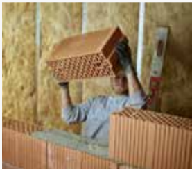
PROBLEM S LEĐIMA I ODE POSAO: Nakon diskus hernije zidaru predstoji promjena djelatnosti.

Već 15 godina radim kao zidar za jednu građevinsku firmu. Rad je fizički naporan i godinama imam bolove u leđima. Prije nekoliko mjeseci dobio sam diskus herniju i otad nisam sposoban za rad, dobijam samo dnevnicke od zdravstvenog osiguranja. Međutim, sada mi je osiguranje javilo da ukida dnevnicke na osnovu izvještaja njihovog doktora od povjerenja, jer sam 100% sposoban za neku drugu djelatnost u kojoj ne moram podizati teške stvari i dio radnog vremena mogu sjediti. I moj doktor ima slično mišljenje. Smije li osiguranje tek tako odjednom da mi ukine isplatu dnevnica?