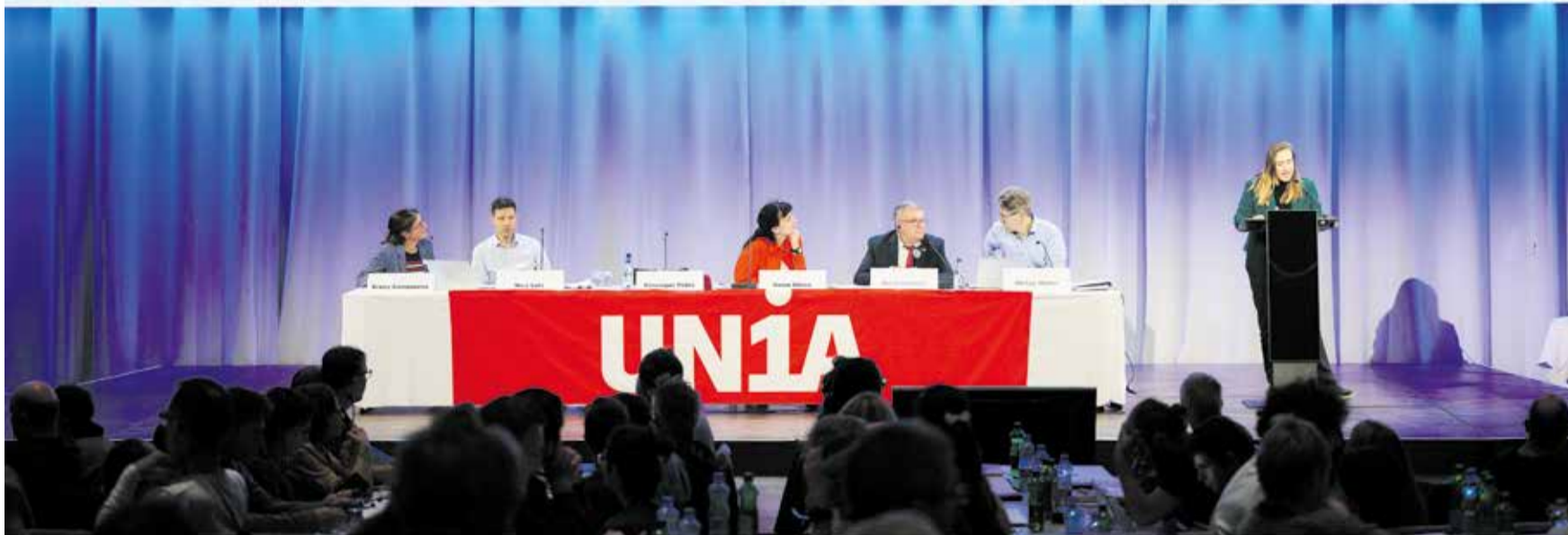
Demokratska inicijativa - za savremena građanska prava

Vanredni kongres Unije održao se 21. oktobra u Bernu. Oko 300 delegata odlučivalo je o reformi statuta i odlukama vezanim za važne kampanje Unije: bolje plate, bolje penzije, kao i skraćivanje radnog vremena uz pun iznos plate i dovoljan broj zaposlenih.