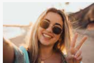
ZASLUŽEN ODMOR: Prilikom rada sa djelimičnim radnim vremenom plata tokom godišnjeg odmora se ne obračunava uvijek kako treba.

U mom prvom ugovoru o rad je dogovoren obim posla od najmanje 40%. Prošle godine sam u drugom ugovoru pristala na varijabilni obim posla. U prosjeku sada radim oko 60% radnog vremena na osnovu satnice od 27 franaka. Imam li tokom odmora pravo na platu koji zarađujem i inače za 60% radnog vremena?