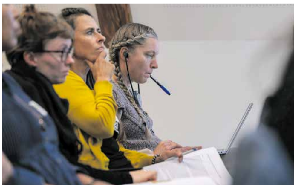
Neophodna je solidarna politika

Učesnici konferencije formulisali su konkretne zahtjeve u skladu sa svojim sopstvenim iskustvima i svakodnevnim borbama. Postavljeni su sljedeći zahtjevi: zajednička borba protiv državnog nasilja prilikom protjerivanja. Kraj izrabljivanja migranata – ista prava za sve! Borba protiv siromaštva, a ne siromaš-