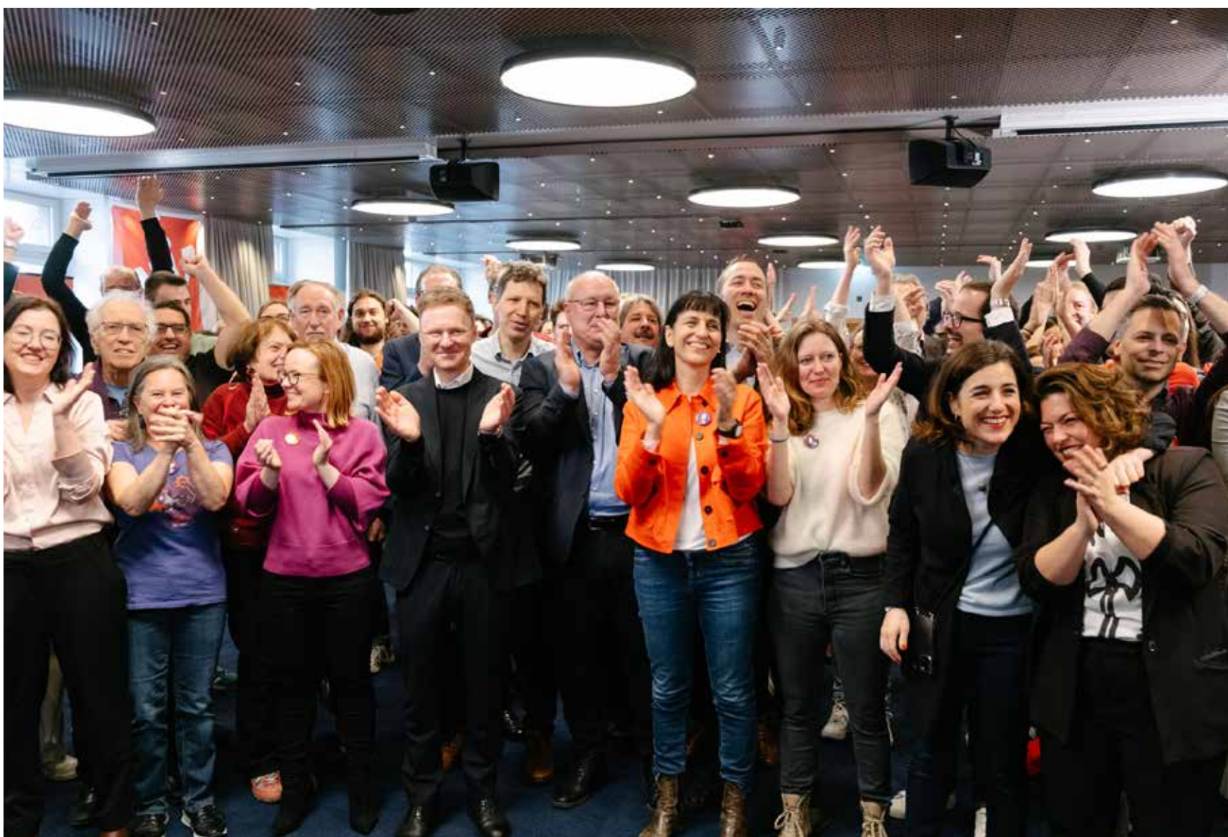
Istorijski uspjeh za radnicku klasu i cijelo stanovništvo.

Švajcarci sa pravom glasa su 3. marta 2024. velikom većinom izglasali narodnu inicijativu «Za bolji život u starosti» (inicijativu za 13. AHV penziju). Jasno je da je ovo istorijski uspjeh sindikata, i velika pobjeda solidarnosti i pravde. Narod i Savjeti su iznenađujuće velikom većinom usvojili inicijativu za 13. AHV penziju. Istovremeno je jasno odbijena inicijativa kojom se predlaže podizanje starosne granice za penziju. Za penzionere ovo znači izjednačavanje sa poskupljenjima. Za ostalo stanovništvo korak ka više solidarnosti. Ovo nije važno samo u simboličnom smislu – daje nam nadu u preokret u shvatanju društva.