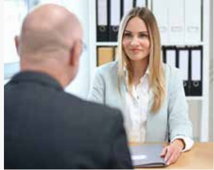
Razgovor za posao: Ne morate da odgovorite na sve.

Moja sestra je prošle sedmice imala razgovor za posao bibliotekarke. Tom prilikom joj je postavljeno pitanje da li želi djecu. Smije li nadređeni da postavlja takva pitanja?