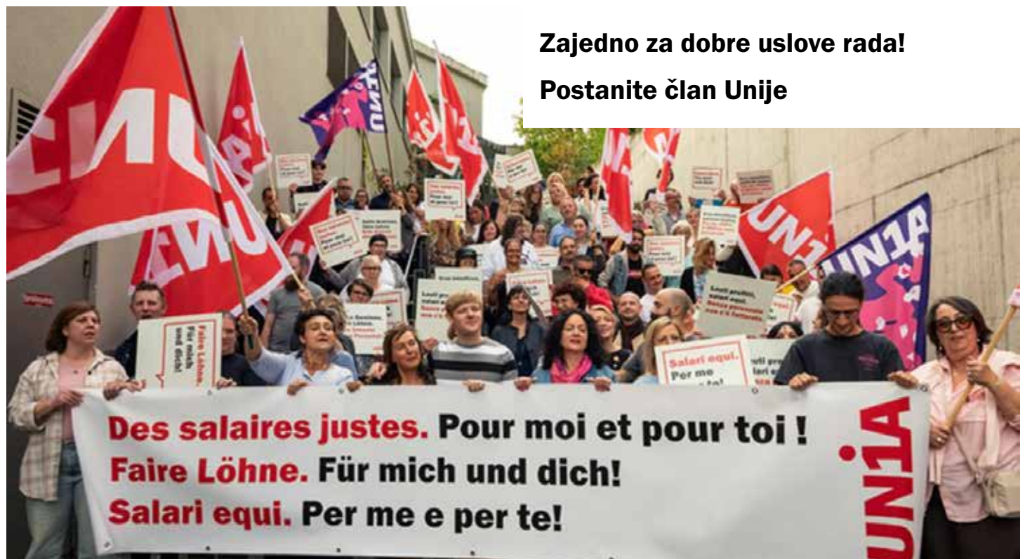
Coop grupacija zahvaljujući migrantima na stabilnim nogama