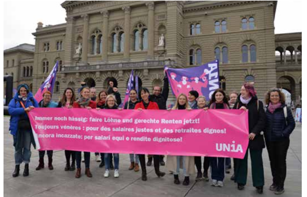
Žene zahtijevaju jednakost i prestanak seksualnog uznemiravanja na radnom mjestu i u svakodnevnom životu

davaca kako bi osigurala zaštitu zaposlenih. Važne teme i mnogi zahtjevi zaposlenih još uvijek su bez odgovora.